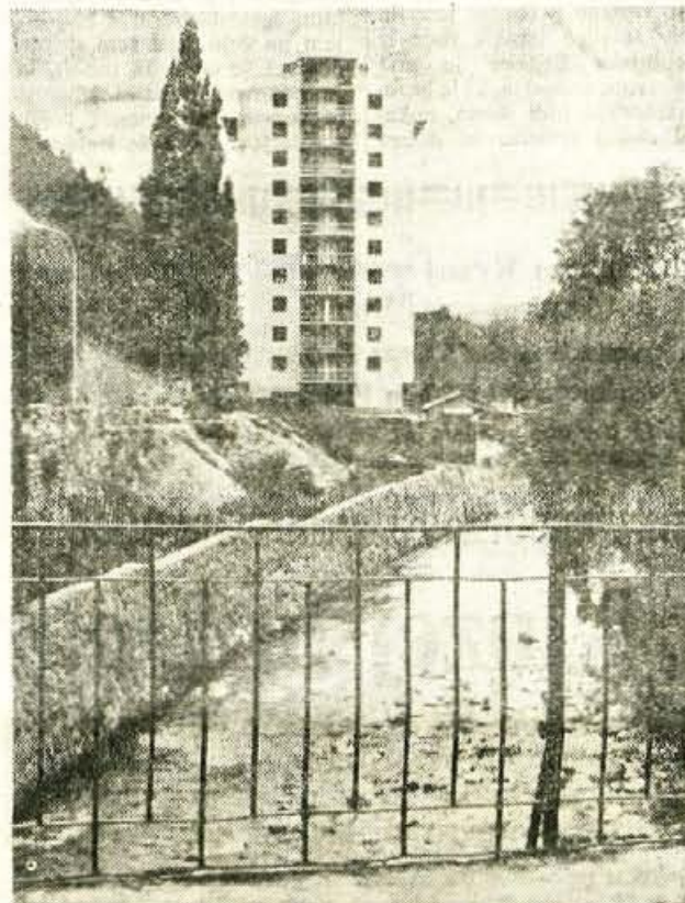
Stanovanjska stolpnica v Tržiču, ki bo precej spremenila panoramo tega mesta, letos ne bo dograjena