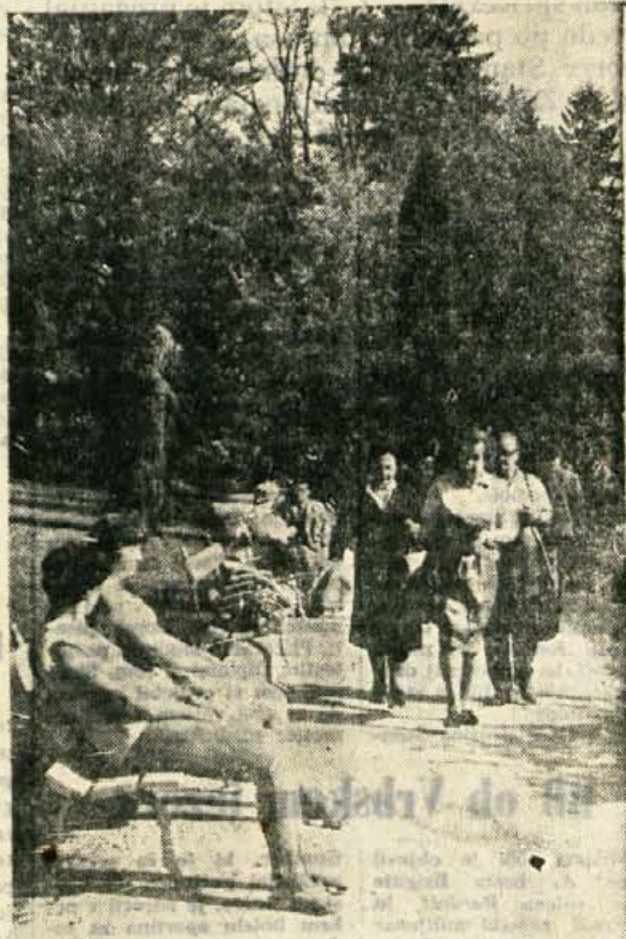
Prijeten sprejem in počitek ob obali blejskega jezera