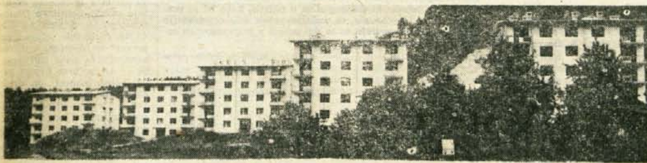
Stanovanjski bloki v Blisrici pri Trzinu, od katerih bosta zadnja dva (na sliki desno) letos vseljiva