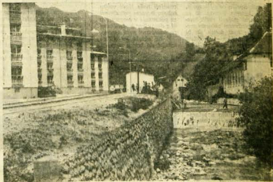
Tole je jez na Ravnah v Trzihu, kjer je tlk ob strugi pločnik za pešce. Ker je nekoliko nagnjen, je bilo tu že več nesreč. Pred nedavnim je v strugi običal otroški voziček, v katerem je bil 10 mesecev star otrok. Na srečo se je vse dobro izteklo. Podobnih primerov pa bo lahko še več, če za to odgovorni ne bodo poskrbeli za ograjo ob strugi