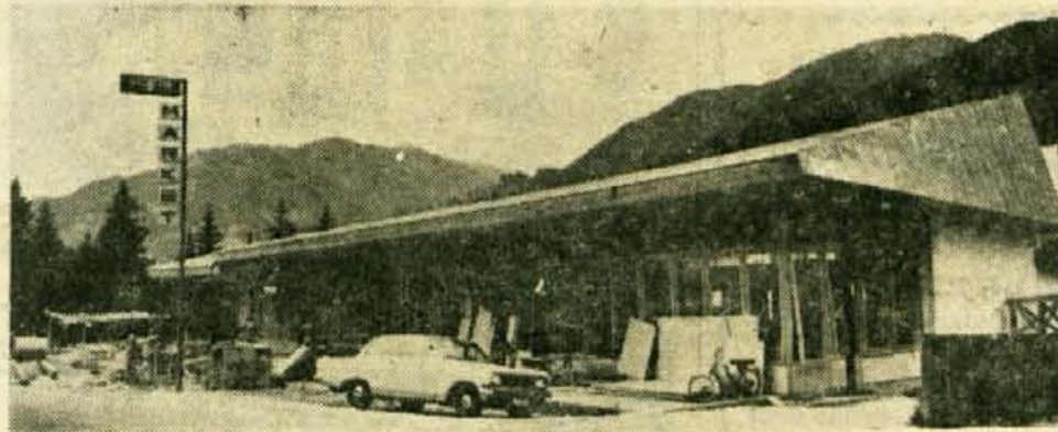
Nasproti hotela Prlsank v Kranjski gori gradi veletrgovina Prehrana Ljubljana sodobno samopostrežno trgovino — Market. Stavba je zunaj gotova, oprema pa še ni popolnoma urejena. Pod to stavbo gradijo tudi garaže, zraven gradi nove prostore tudi pošta

Ker pa nimajo potrebnih podatkov iz časa vojne in vse do 1957. leta, prosijo vse mladinske aktiviste in organizatorje imenovanega obdobja, da se prijavijo na občinski komite ZMS Trzič do 15. julija.