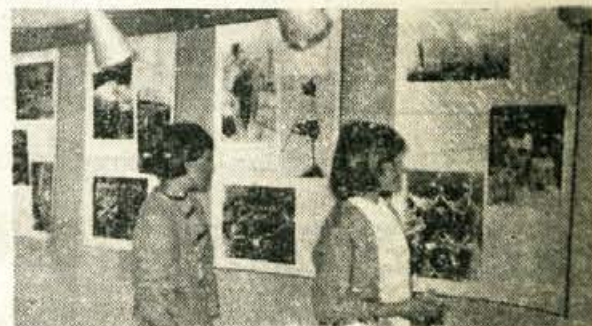
Z razstave fotoamaterjev Zelezne Kaple in Kranja v galeriji Prešernove hiše

KRANJ: razstava koroških in kranjskih fotoamaterjev — V soboto (11. junija) so v razstavnih prostorih Prešernovega spominskega muzeja v Kranju odprli skupno razstavo fotoamaterjev iz Zelezne Kaple in iz Kranja. Razstava bo odprta do 20. junija, sodi pa v okvir kulturnega sodelovanja med omenjenima občinama.