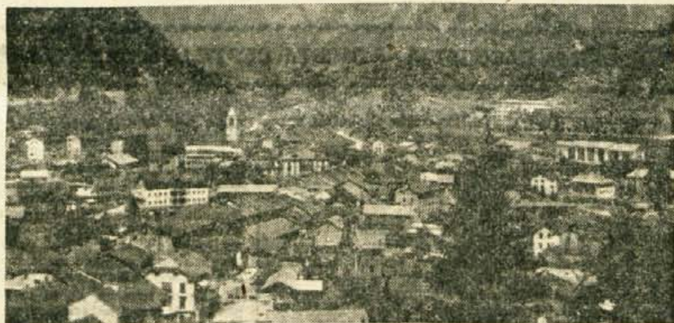
Nekdanji Slovenski Pontabelj (563 m)

Na koncu poti po Kanalski dolini smo! Le še Pontabelj je pred nami. To je večji kraj na nekdanji koroško-furlanski meji, ki pa je bila hkrati tudi avstrijsko-italijanska. Zato je kraj postal na tem bregu izrazito nemški, Pontebba na oni strani mejnega mostu čez Studeno (Pontebana) pa italijanska. Vendar pa se je Pontabelj v zgodovinskih virih iz l. 1611 imenoval še Windisch Pontafel!