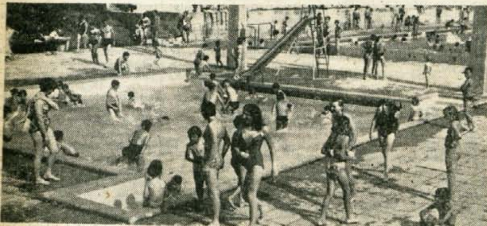
Kopalna sezona na Gorenjskem se je pričela. Te dni so vsa kopaljšča polna kopalcev. V Kranju je bilo v nedeljo na kopaljšču celo 1200 kopalcev. Na sliki: kranjski mali bazen je premajhen za otroke. Vse več staršev resno pomišlja, ali je varno pustiti otroke v prenatrpan bazenček.

Kako je s pripravami za pokopališče za desni breg Save?