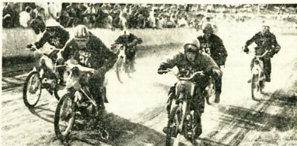
Kaže, da so v nedeljo na dirkališču v Stražišču mopedi odprli novo stran v zgodovini moto športa v Kranju. Navadni stroji so z drznimi tekmovalci nudili lep športni užitek.

REZULTATI: 1. Puhar (Senčur), 2. Markič (Kranj), 3. Hribernik, 4. Bizjak (oba Senčur), 5. Hafner (Kranj), 6. Sodja (Bohinj), 7. Spendl (Kamnik), 8. Pivk (Tržič) itd. pc