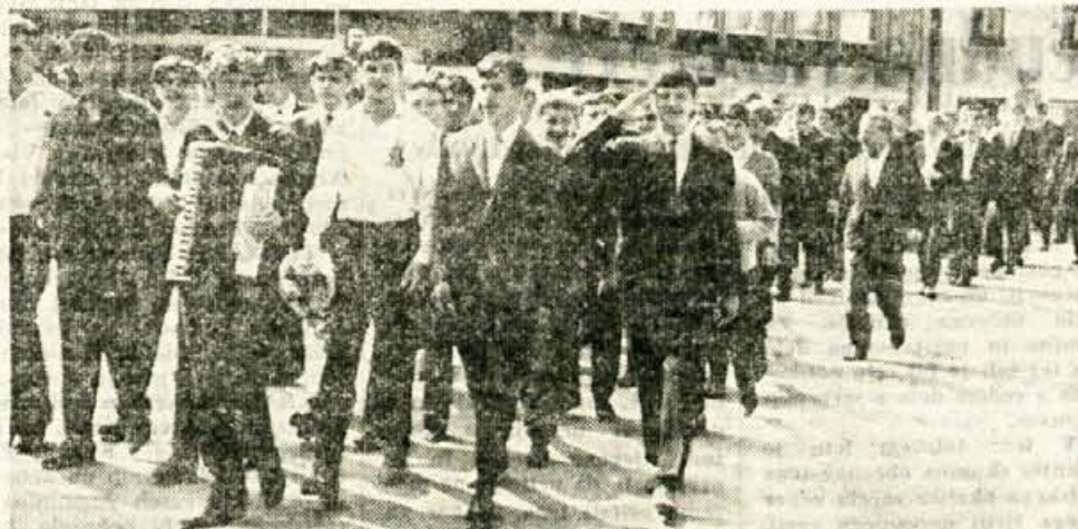
V soboto (11. junija) so se s sprevedom poslovili od šole učenci III. letnika poklicne šole za elektro in kovinsko stroko v Kranju. Več kot 50 učencev je z rdečimi nagelji odšlo po kranjskih ulicah in s tem prešerno zaključilo triletno šolanje