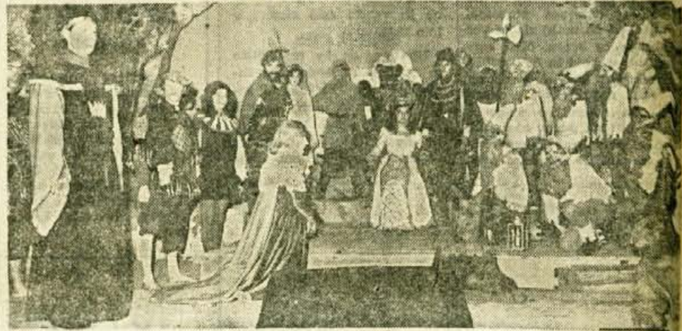
Zaključni prizor iz »Sneguljčice«, s katero so žirovniški in breznški kulturni delavci razsiliti mlado in staro za dedka Mraza.

Prešernovo gledališče in Mestno gledališče ljubljansko sta popoldanske predstavo namenili kot novoletno darilo upokoјencem, zato so