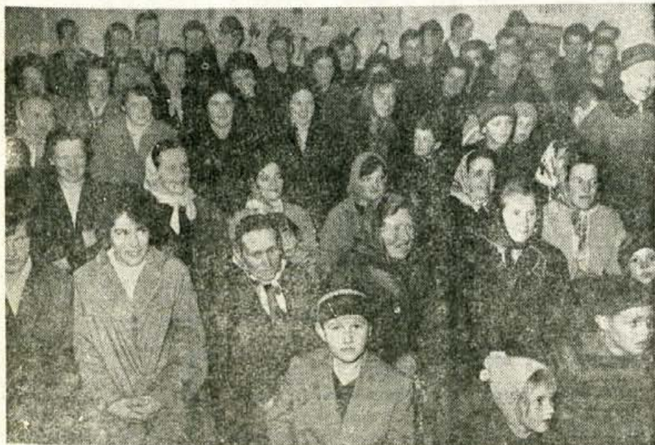
Pred Novim letom — v torek, 23. decembra, so naši novinarji obiskali Senturško goro. Priradili so novinarski večer in se tako oddolžili zvestim bralcem v teh hribovskih vasih. Hkrati so prispevali delež k ugodnejšemu počutju ob zaključku leta, zlasti naklanski godci in humorist Lipce. No, kljub temu so obiskovalci, ki so do zadnjega kotička napolnili dvorano, zvedeli marsikaj zanimivega in spoznali ljudi — novinarje, ki jih sicer poznajo le s časopisnih stolpcev.

in Urad. vestnik Gorenjske Izdaja in tiska CP »Gorenjski tisk« Kranj, Koroška cesta 8. Naslov uredništva: Kranj, Cesta Staneta Zagarja 27 in uprave: Kranj, Koroška cesta 8. Tekoči račun pri NB v Kranju 515-1-1135. Telefoni redakcije 21-835, 22-152 uprava in tiskarna 21-190, 21-475, 21-897. Naročnina letna 20 novih dinarjev (n. d.) ali 2.000 starih dinarjev (s. d.), mesečno 1.70 n. d. ali 170 s. d. Cena posameznih števil 0.40 n. d. ali 40 s. d. Mall oglasi za naročnike 0.40 n. d. ali 40 s. d. za nenaročnike 0.50 n. d. ali 50 s. d. beseda. Neplačanih oglasov ne objavljamo