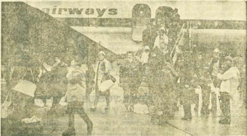
Zimska sezona se je začela. Zal za sedaj spet nagaja vreme. Snega je premalo. Sicer pa je bilo, vsaj za praznike, na Gorenjskem dovolj turistov — domačih in tujih. Na sliki: letališče na Brniku je oživelo tudi pozimi. Čedalje več tujih turistov prihaja z letali na zimski oddih

Kot nam je znano namerava na tej progi železnica voziti le še do vključno 10. januarja. Kako se bo zadeva razpletala naprej, bomo še poročali. — B. B.