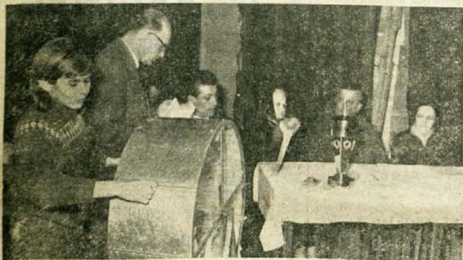
Zreb je odločil. Dve prvi nagradi sta ostali v Selški dolini. Pred nabito polno dvorano v Zemljičih se je boben sreče stokrat zavrtel. Več o žrebanju berite na 5. strani

V tej smeri delovni ljudje po vsej Gorenjski žele in pričakujejo od kongresa dosti konkretnih rešitev.