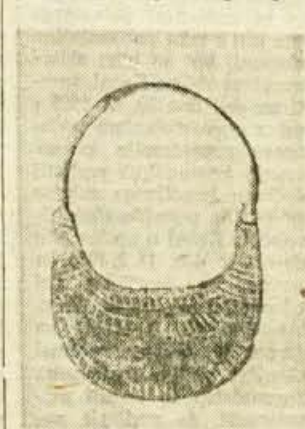
Luničast uhan okrašen z gravuro

blematičen (morda je to skromna oznaka romarstva), prav tako pa časovno celoten grob, čeprav je bil pokopan