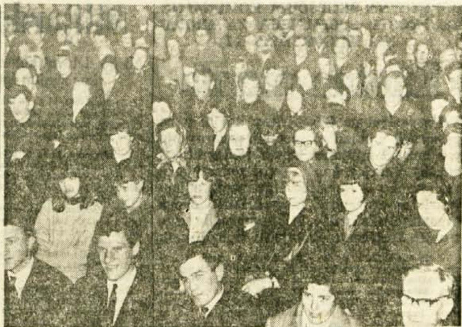
Domala tisoč obiskovalcev se je magnetno v avorano. Doživeli so dve uri razvedrila in napetega pričakovanja.

V odmorih med žrebanjem so se vrstile zabavne točke. V zabavnem delu programa so se gledalcem predstavili tudi trije Jeseničani, člani državne reprezentance v ho-