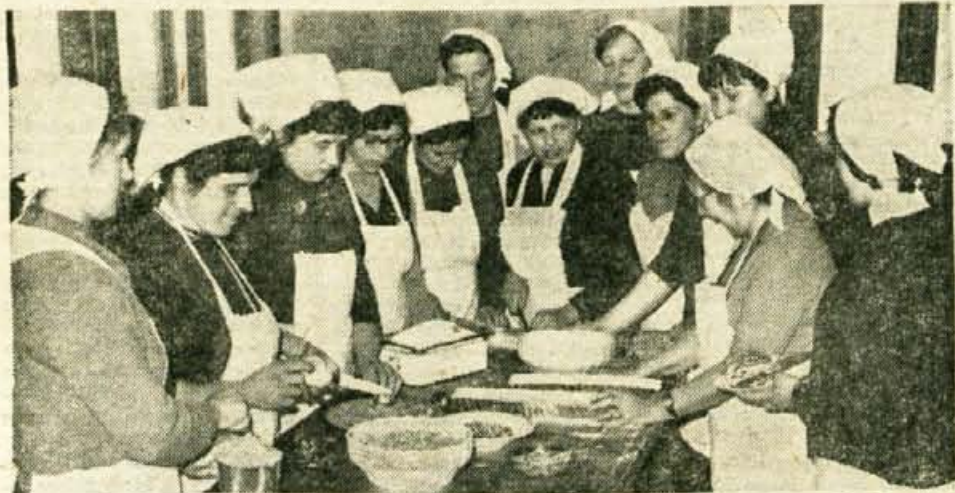
25 deklet iz bližnje in dalnje okolice Zmncu se je naučilo kuhati. Na sliki: Z zaključka tečaja pretekli ponedeljek

Da bi odstranili posledice lanskih poplav Save Dolinke in njenih hudourniških pritokov, bodo letos uredili mostiče čez Savo na Hrušicah, zavarovali obrežje Save pri Marčuljku in Na Savi in Jesenicah ter druga najkritičnejša mesta. Za ta dela je predvidenih okroglo 410 tisoč novih dinarjev. Okroglo 100.000 novih dinarjev (10 milijonov starih) pa bodo, kot je sklenila občinska skupščina, dodelili prizadetim krajevnim skupnostim za manjša zavarovalna dela in odpravo škode od poplav na tem območju. — B. B.