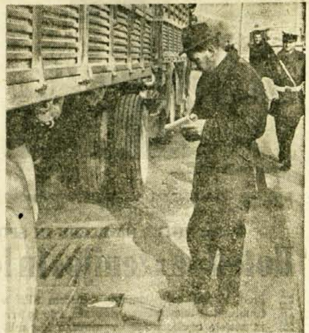
Kontrola obremenjenosti vozil na cestah je pokazala, da bodo tudi v bodoče podobne akcije nujne. Če že ni dovolj denarja za vzdrževanje cest jih moramo vsaj malo boljše paziti.

Se nekaj besed o tablah, ki določajo nosilnost na cesti. Ljudje se zaradi sprememb večkrat pritožujejo, vendar neupravičeno. Določeno je namreč, da inšpektorat v spomladanskem času lahko določi manjše obtežitve in ko te obtežitve zopet dvignejo pride do negodovanja, ker cesta res ni bila