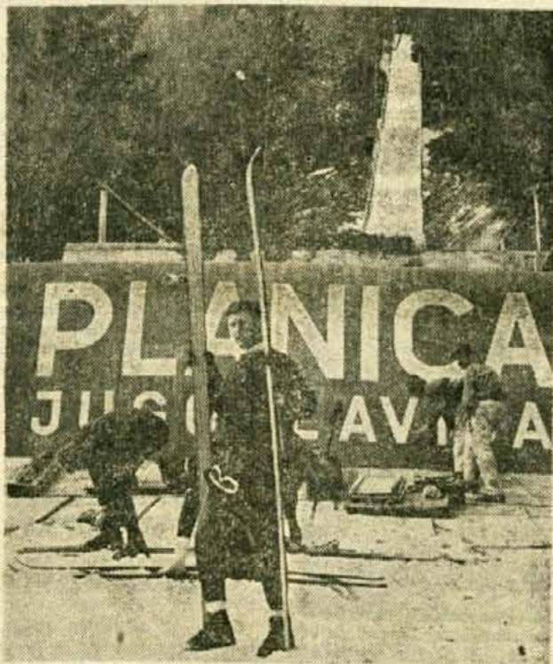
SLAVJE VELIKANKE — Planiška 120 metrska skakalnica doživlja v teh dneh svoj jubilej. Ob 30. obletnici prvega skoka čez 100 m so se zbrali najboljši skakalci na svetu iz 14 držav. Nekatere je včerajšnji sneg omajal v slovesnem razpoloženju, drugi pa pravijo, da bo šele na ta način velikanka lahko pokazala vsem obiskovalcem svojo pravo lepoto

tekmovalja. V nedeljo, 3. aprila, pa bodo odšle partizanske patrole po nekdanjih poteh borcev preko Rovta in Križne gore. K. M.