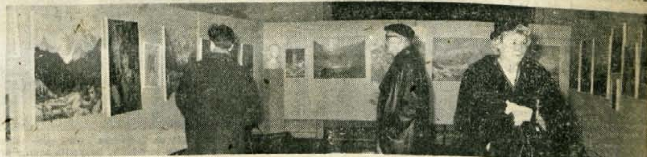
Preteklo soboto, 12. februarja popoldne so na Jesenicah otvorili razstavo članov DOLIK