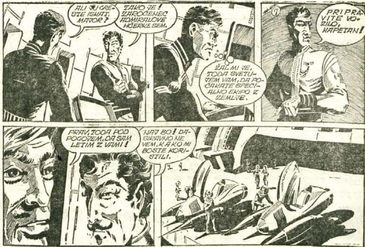
PANORAMA • PANORAMA • PANORAMA • PANORAMA • PANORAMA • PANORAMA • PANORAMA • PANORAMA