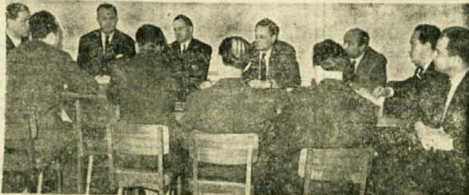
Svetozar Vukmanović-Tempo v pogovoru s predstavniki tržiške tovarne »Peko«

Te dni smo zvedeli, da je zadeva dozorela tako daleč, da bodo obe hiši (kolikor sta pač zgrajeni) podrti. Zanimivo je, da sta lastnika trmasto odbila celo velkodušno ponudbo skupščine, da bo podiranje opravila na svoje stroške, čeprav bi ga pravzaprav morala plačati sama.