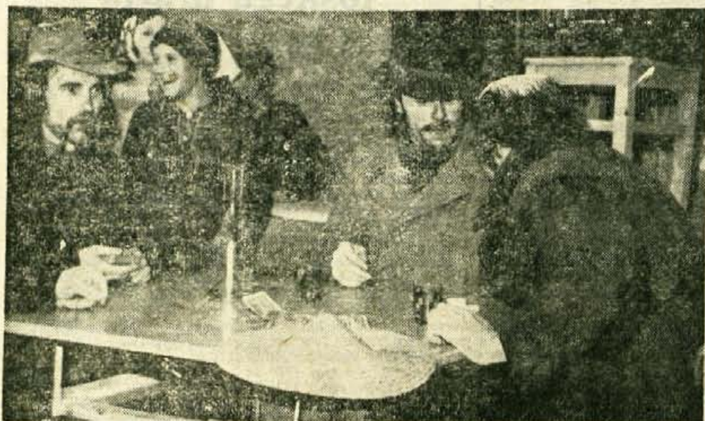
Kvartopirci v krčmi sredi ceste