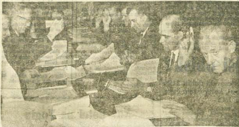
Preden so dvignili roke o najvažnejših zadevah, so člani jeseniške občinske skupščine v tokrek zelo temeljito razpravljali

Za vodovode je predvideno 8,8 milijonov din, kjer velja posebej omeniti dograditev zajetja v Podlublju, pri izdatkih za kanalizacijo, za kar je predvideno 26.380.000 din, pa kanalizacijo Snakovo-Sebenje-Ziganja vas. — S. B.