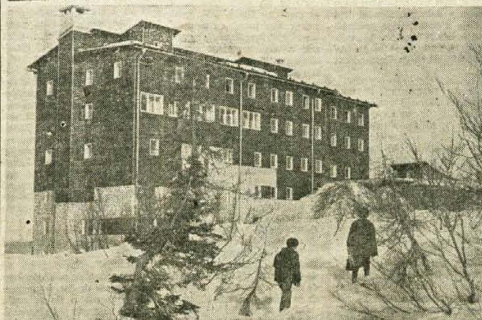
Ze ob sedanji ureditvi žičnic, prometa in neslutnih možnosti širokega okolja, predstavlja nov hotel na Voglu prvi temeljni kamen v razvoju našega visokogorskega turizma