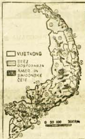
Slika zelo slikovito prikazuje položaj v Južnem Vietnamu. Na prvi pogled je jasno, da imajo večino ozemlja v svojih rokah sile narodnoosvobodilnega gibanja (dobre 2/3 vsega ozemlja) (»Süddeutsche Zeitung« München)

● Po pisanju brazilskega dnevnika Journal de Brasilia namerava šest duhovnikov iz brazilске zvezne države Minas Gerais za prositi papeža, da bi jim dovolil ženitev. Duhovniki ki pravijo, da je bolje biti dober družinski oče kot slab dušni pastir. Pristavljajo pa, da ne bodo zahtevali odprave celibata, temveč bodo samo zahtevali zase izjemo spričo »posebnih okoliščin«.