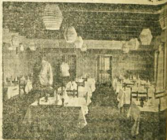
Ena izmed dveh restavracij hotela, pripravljena za sprejem gostov

to prav, Morda bi morali tudi po naših tovarnah računati v dolarjih, in bi se lažje usmerjali na zunanji trg. Ker se z dolarji nismo znašli, smo preračunali na dinarje. Soba z eno posteljo 3.000, soba z dvema posteljama 5.000 pens. v 1. primeru 5.500, v drugem 5.300 starih dinarjev itd. To seveda v dolarskem rangju za inozemce, domači imajo 20 odstotkov popusta. Kolkoli stane čaj, juha in podobno nismo več spraševali, ker smo si že kar predstavljali. Če se k temu doda še nihalnica do Vogla in vlečnice za naprej, potem je stvar res precej »široka«, »evropska«, ki si je vsakdo ne more privoščiti. Gotovo pa je res, da se bomo morali privaditi različnim cenam in prilagajati svoje želje danim možnostim. Končno pa so na Voglu že možnosti v brunaricah s skupnimi ležišči ki jih je 60 in z dokaj bolj »domaćimi« cenami.