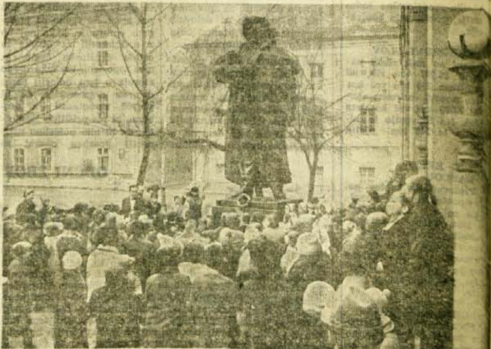
Razen kulturnih ustanov in široke javnosti, so se zlasti šole letos dostojno poklonile Prešernovemu spominu. Prizor pred spomenikom v Kranju.

Zagotovite si najcenejše in kvalitetno branje s takojšnjim vpisom v članstvo Prešernove družbe, da ne ostanete brez najbolj popularnih knjižnih zbirk kakor so ostali mnogi letos.