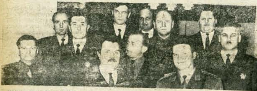
Fotograf prikazuje nagrajence

Sicer bi lahko zaradi trenutnih koristi napravili dosti (Nadalj. na 3. strani)