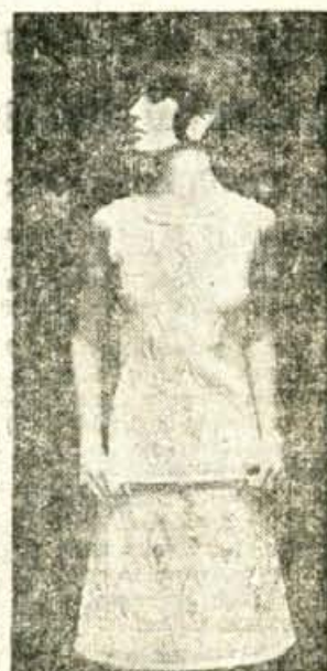
Večerna obleka v Courrages stilu. Obleka je popularna preprosta. Pas je pomaknjen daleč navzdol.

Krilo in bluzo najdemo verjetno prav v vsaki omari z ženskimi oblačili. Saj je praktično in primerno vsaki postavi. Gotovo ima vsaka izmed vas več kot eno bluzo ali puli. Tudi modni ustvarjalci zagovarjajo to kombinacijo in so celo letos na modnih revijah prikazali vrsto teh modelov. Letos so zelo moderna karirasta krila (v zelo zmernih barvah), seveda bomo k takemu krilu oblekle le enobarvno bluzo oziroma puli. Krilo 1966 naj bo širše z gubami ali brez, zvončasto krojeno ali rezano v pole in precej kratko. Vendar, to le za ženske z merami vitkih manekenk. Če nismo tako zelo prepičane v svoje vitkost, si bomo izbrale raje preprosto gladko krilo, ne preozko in zopet ne preširoko. Če imamo v omari celo vrsto pisanih bluz in vzorčastih puljev tudi ne bomo segle po pisanih krilih, temveč kupile enobarvne.