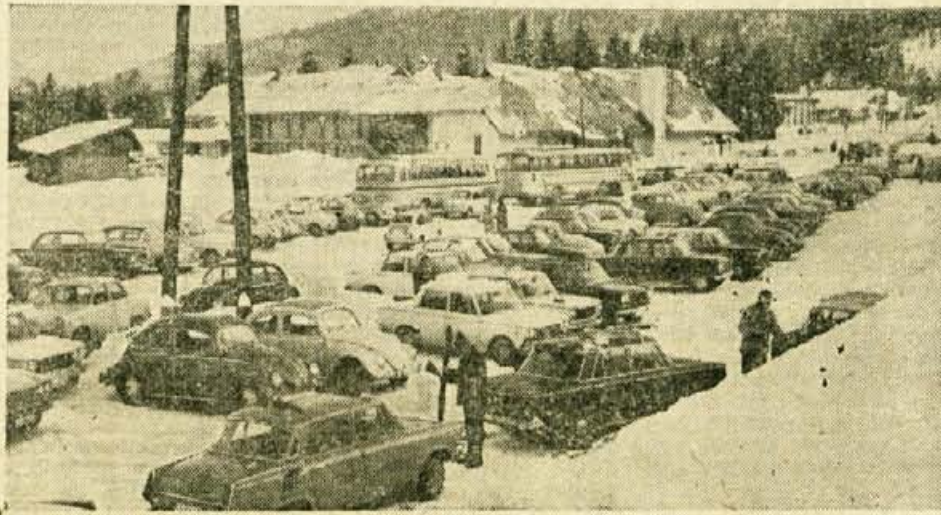
Jutri, v četrtek, 16. decembra, bo v Kranjski gori posvetovanje Gorenjske turistične zveze o pripravah na letošnjo zimsko sezono v Gornjesavski dolini in o težavah, ki so se pri tem pojavile. Kot dokazuje gornja slika (to nedeljo) je Kranjska gora res privlačna. Toda gosti imajo marsikatero pripombo na organizacijo, postrežbo in tudi na cene. Sem sodi tudi parkirnina po 200 dinarjev, ki je že kar preveč evropska