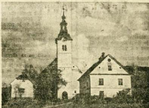
Cerkev v Skaručni