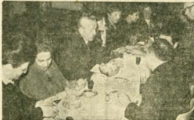
Kolektiv Zdravstvenega doma v Kranju že vsa leta posveča veliko pozornost svojim uslužbencem, ki odhajajo v pokoj. V sredo so imeli zopet podobno slovesnost

Minul redni letni občni zbor Turističnega društva Cerklje je bil eden najbolj pestrih in razgibanih tamkajšnjih sestankov oz. zborov. Kritično so pregledali svoje dosedanje delo in nakazali vrsto smernic za bodoče. Desetim, ki so sodelovali v tekmovanju društva o ureditvi in lepšem izgledu kraja so podelili nagrade.