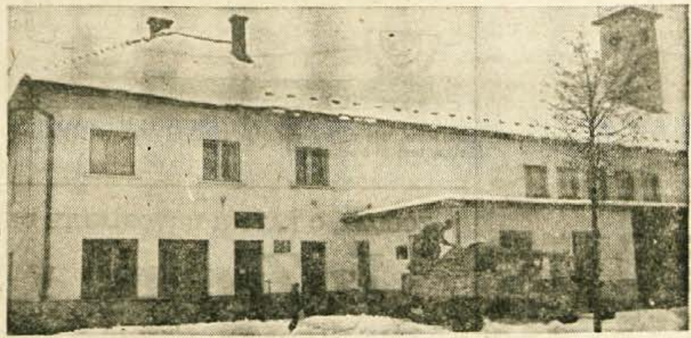
Zadružni dom Mavčiče