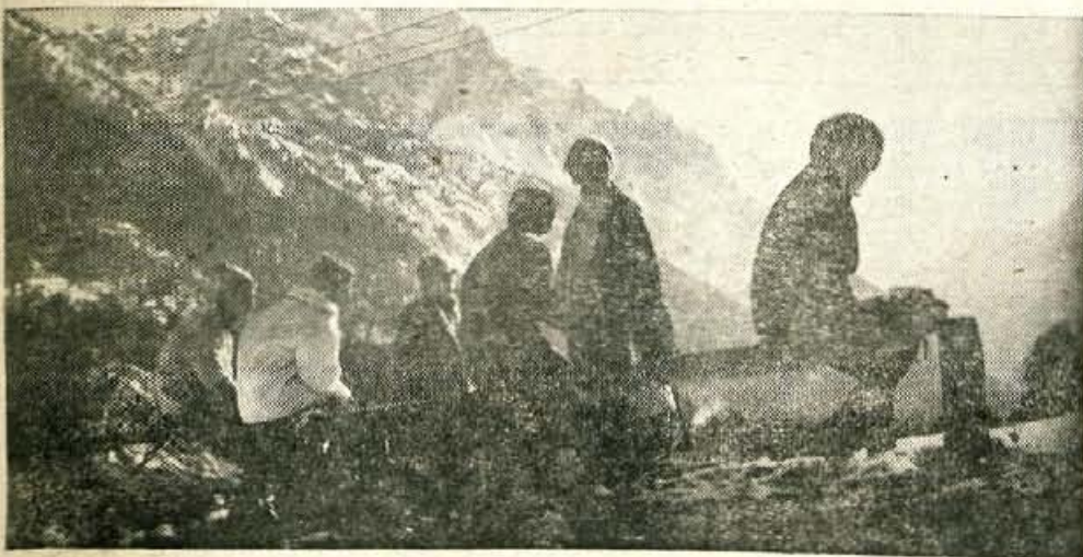
Ni daleč do zimske sezone

GLASILO SOCIALISTICNE ZVEZE DELOVNEGA LJUDSTVA ZA GORENJSKO