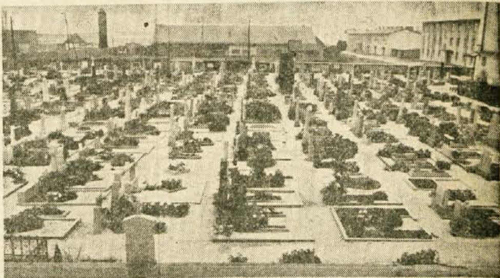
Stražiško pokopališče je res sredi zgradb, zato bo problem treba rešiti čimprej.

Po tem zboru volivcev je kazalo, da se stvari obračajo na bolje in da bo ostal volk sit in koza cela, ne pa, da bo ta množičen sestanek, na katerem so občani nedvoumno demokratično povedali svoje zahteve, postal še skoraj večji kamen spouke kot pokopališče samo. Sanitarna inšpekcija je namreč začasno spet dovolila pokope, dokler ni skupščina občine Kranj sprejela sklepa, »da je