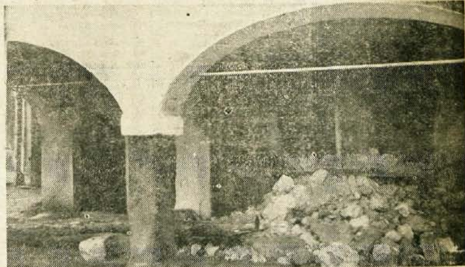
Gabričeva kovačija v Kranju je že zelo stara in ni čudno, če se podira

V kamniški občini bodo ponovno popisali stanovanjske hiše, stanovanja in poslovne prostore, da bi ugotovili njihove vrednosti v primerjavi s popisom iz leta 1959. Tudi to pot bo osnova točkovanje, ki bo upoštevalo vrsto in kakovost zgradbe, konstrukcijo, funkcionalnost, položaj v zgradbi, starost in obrabljenost.