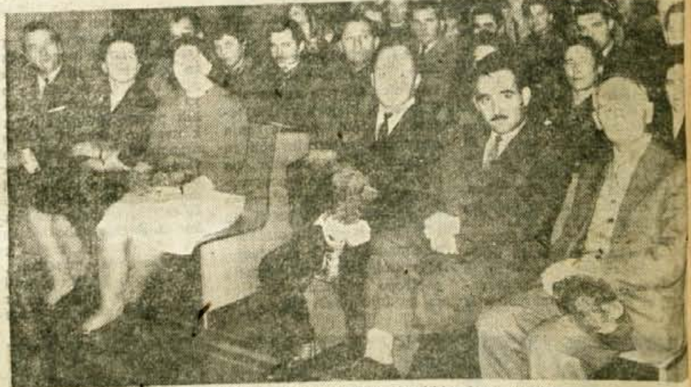
Udeleženci krvodajalske svečanosti, v ospredju so sovjetski in drugi gostje.

šim krvodajalcem in jim podelil značke, ki jih podeljujejo najboljšim krvodajalcem Sovjetske zveze. Sovjetski gostje so skupaj z drugimi udeleženci prireditve z velikim navdušenjem pozdravili nastop moškega pevskega zbora Svobode iz Stražišča in ansambla Veseli planšarji.