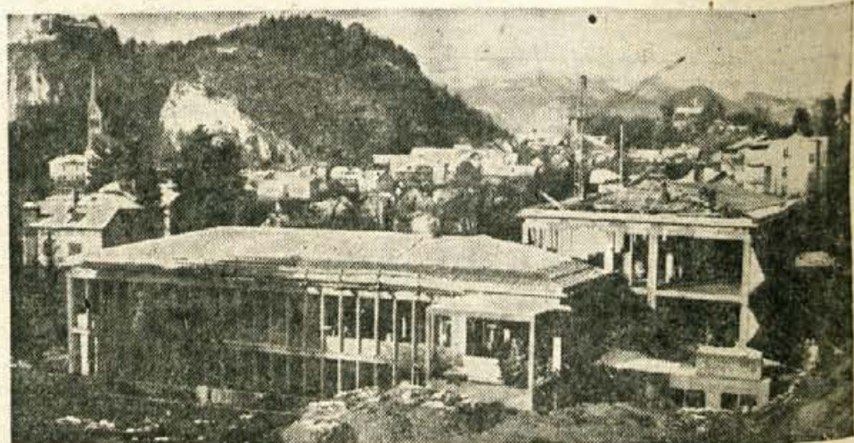
Bodoči zdravstveni dom Bled je že pod streho. Z obrtniški deli so pričeli pred nedavnimi, zaostajajo le dela pri napeljavi vodovoda in elektrike. Sredstva za nadaljevanje gradnje so zagotovljena, vendar pa bo zaradi podražitve gradbenega materiala potrebno zagotoviti še dopolnilne viře

odvojene v pionirsko knjižnico in urejene po sistemu za mladino. S tem se je močno povečala izposoja in razbremenilo delo knjižničarjev. Leta 1964 se je preselila podružnica ljudske knjižnice na Trati v nove prostore in je bila v letu 1965 urejena po UDK s prostim pristopom in posebno polico za pionirje. V letih 1959 do 1965 je bilo s pomočjo občinskega sveta Svobod nabavljenih deset potujočih kovčkov, ki se izmenjujejo v naslednjih krajih: Podlonk, Zelezniki, Selca, Dražgoše, Bukovščica, Češnjica, Sovodenj, Javorje, Hotavlje, Gorenja vas in Poljane. V kovčkih je danes 1320 knjig.