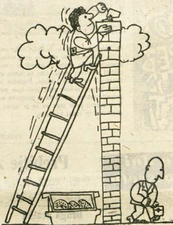
Ja, sedaj pa je Janex že tako visoko, da bo res treba pogledati, kaj bo iz tega nastalo

vse potrebno, da bi vsakdo vsaj osemletko uspešno končal, kajti brez nje skoraj ni drugačno pot do kvalifikacije, nekvalificiranih delavcev pa bo naše gospodarstvo potrebovalo vse manj. —1