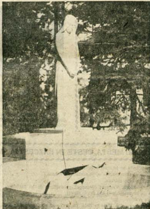
Nekdanji Bernekarjev vodnjak v Kranju

Znova načenjamo vprašanje o rešitvi dragocene umetnine v Kranju. Kar takoj moramo povedati, da so vsa de-