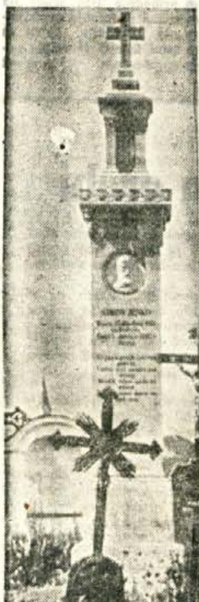
Nagrobnik Simona Jenka kmalu po odkritju leta 1873

V ponedeljek, 18. oktobra, bo poteklo 96 let, kar je v Kranju umrl komaj 34-letni poet Sorškega polja, nežni Simon Jenko. Še danes velja za prvega lirika, takoj za Prešernom.