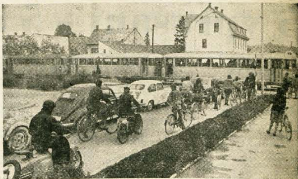
Dvakrat na dan zvalovijo domžalske ceste ob dolgih vrstah kolesarjev

»Harmonika ne gre več. Uvozili so jih toliko kot bi