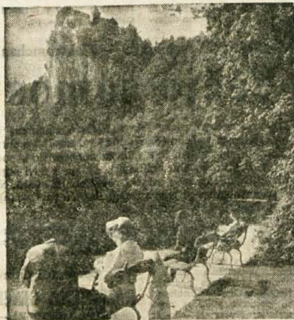
Z oktobrom je na Gorenjskem nastopilo obdobje lepega vremena in turisti na Blede, kolikor jih je še, se na toplen soncu prav prijetno počutijo