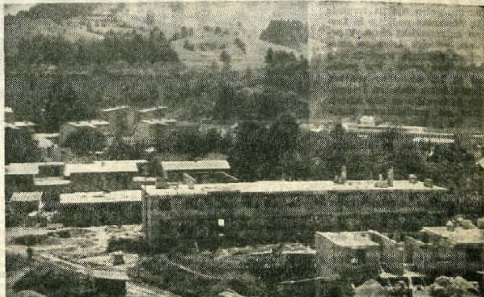
V sedanjem času veliko govorimo tudi o stanarinah. Cena stanovanj je visoka. Rešitve bo treba iskati v smotrnejši gradnji. Prizor iz Skofje Loke.

Zaradi sedanjega neurejenega podvoza imajo koristniki te ceste, ki povezuje Kranj z Besnico oz. desnega brega Save, dokaj neprijetno. Ko bo podvoz dograjen, bodo odstranjene vse te ovire in nevšečnosti, kraj sam pa bo dobil v tem delu lep in urejen videz. Predvidoma bodo dela končana do letošnje zime.