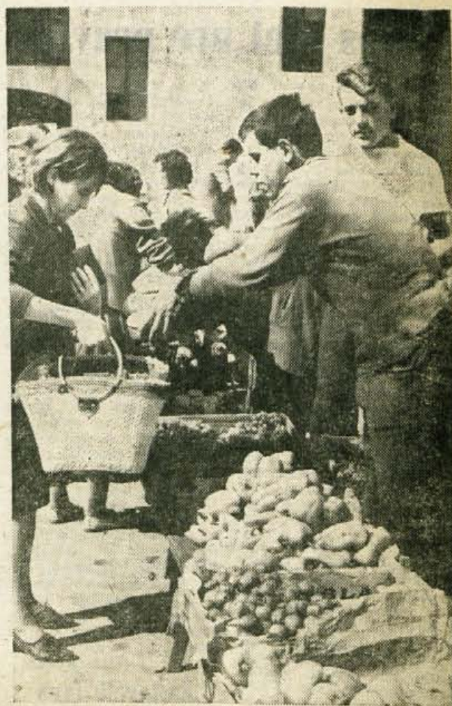
Motiv z jesenske kranjske tržnice: paprike so drage pa še dobijo se ne vsak dan; povpraševanje je zato veliko

Koliko je manjša prodaja različnih osnovnih prehrabenihih artiklov v avgustu res posledica spremenjene struk-