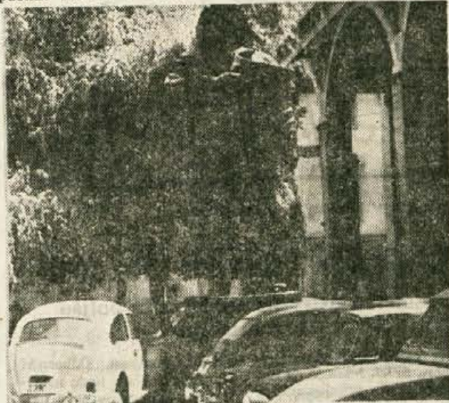
Prešernov kip pred Tahijinim hramom v Kranju v senci dreves in avtomobilov. — So to tudi sence nad Prešernovim gledališčem?