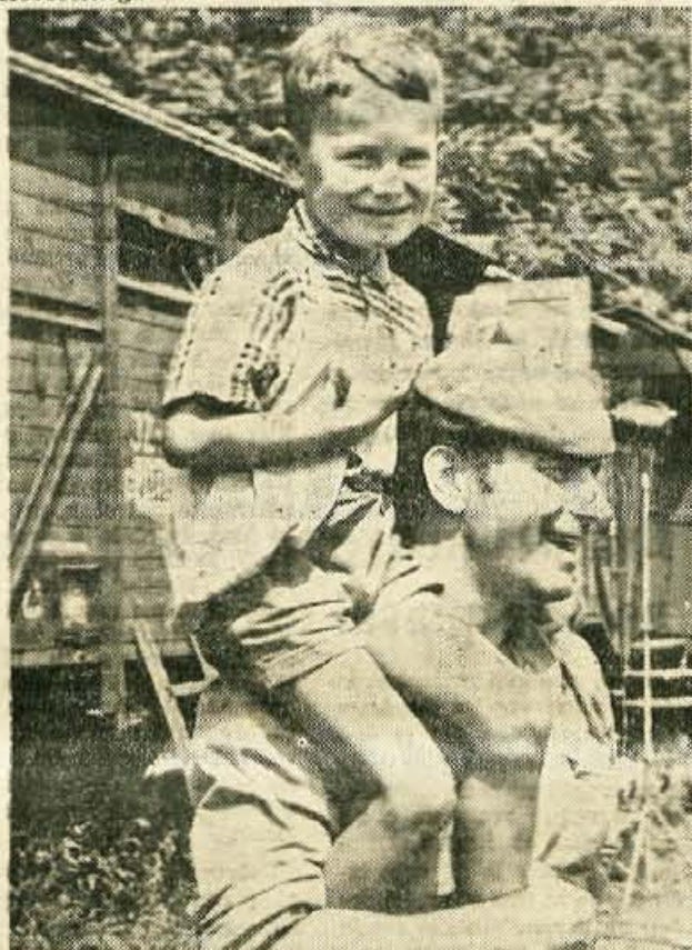
»Hej konjček!« Igralec je vedno igralec

poletje«. Producent filma je ljubljanski Viba film, režiser pa Jože Babič. Scenarij je napisal Branko Pleša, snemalno knjigo pa sta uredila režiser Jože Babič in Djordje Sestar.