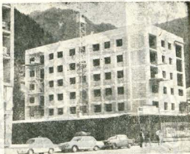
TRGOVSKOSTANOVANJSKA STAVBA NA JESENICAH

V letošnjem prvem polletju so se — v glavnem zaradi neposredne prodaje potrošnikom — zmanjšale tudi odkupljene količine zelenjave za 37,6% in krompirja za 62,6%.