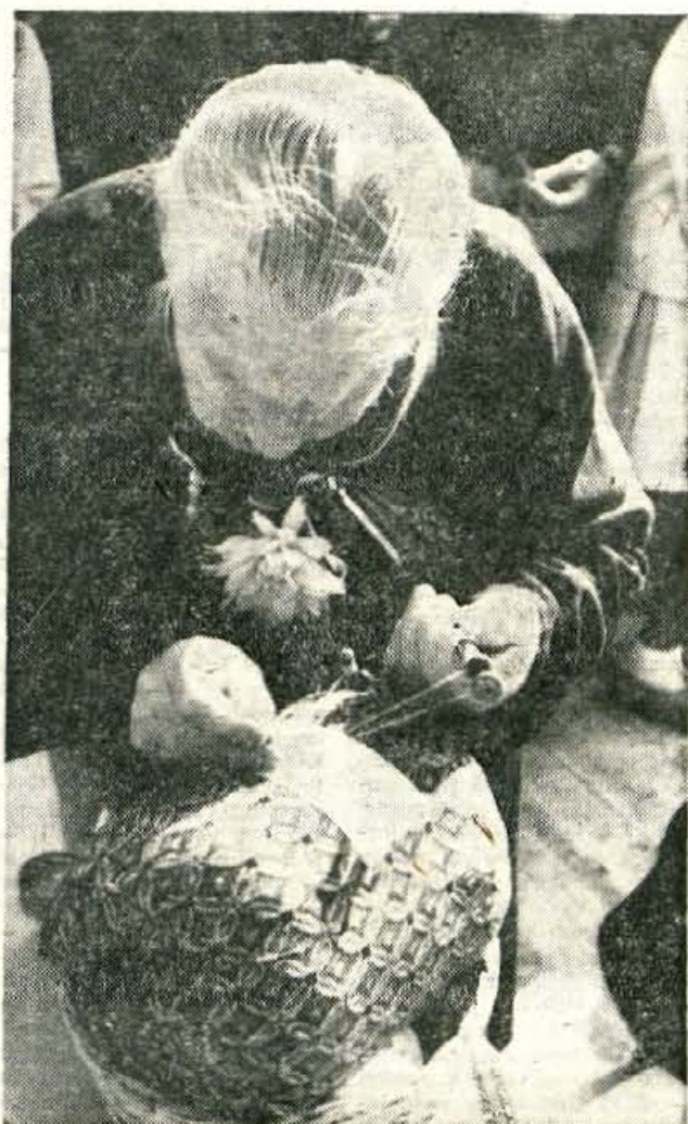
Španskova mama še vedno hitro in lepo kleklja, čeprav so njeni lasje že čisto sivi in se ji roke že malo tresejo

Ura je devet odbila / u turnu sv. Antona; / varujte se ognja in otrok, / da ne bo prevelik jok! / Ura je enajst odbila / u turnu sv. Antona; / varujte se ognja in tatov, / da ne bo prevelik rahov (= hrup), / možje le brž domov! / Ura je povnoč odbila / u turnu sv. Antona; / varujte se ognja in ljudi, / da vam nebi nrevec