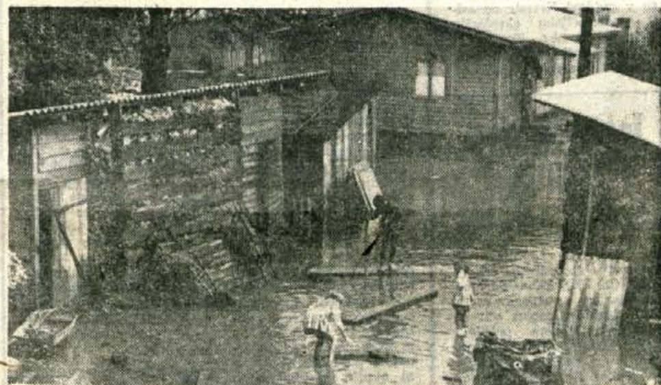
Dokaj grozovit je pogled na dvorišče barak Vodne skupnosti Gorenjske za tovarno Iskra

delno pa tudi električno napeljavno. Prav tako so ostali brez mostu v Globokem in v Lancovem. Zaradi tega je Krpa sedaj praktično odrezana od ostalih krajev, vsaj kar zadeva avtobusni promet. Večjo škodo je povzročila na področju škofjeloške občine tudi Sora. V Zmlincu v Poljanski dolini je Sora odnesla most. Na mnogih me-