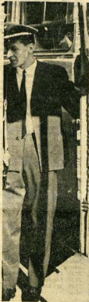
Reporter na akciji

Odpelji sem se zato — tokrat ne kot sprevodnik, marveč kot potnik — na Golnik.