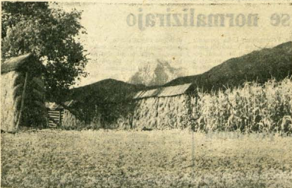
Cvetoča ajda, njive z obetajočimi pridelki, napolnjeni kozolci in v ozadju naravne kulise vabljivih vrhov, to je po vseh naših krajih v teh dneh tudi romantična idila tolikih turistov. Toda za kmetovalce in nas vse pa postaja kmetijstvo tudi vse večja dejavnost gospodarstva.