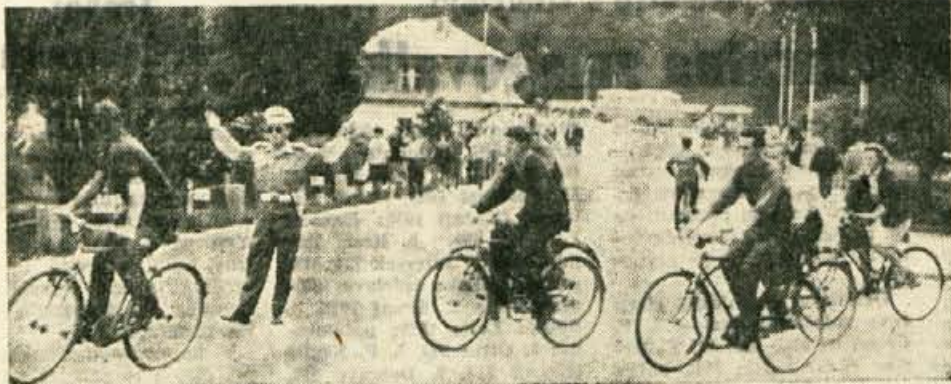
V Kranju ob dveh, ko morajo na vseh križiščih mlilčniki usmerjati promet