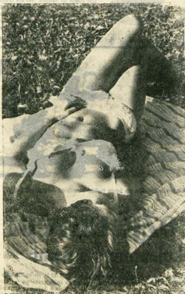
S kopaljšča na Sori v Skofji Loki