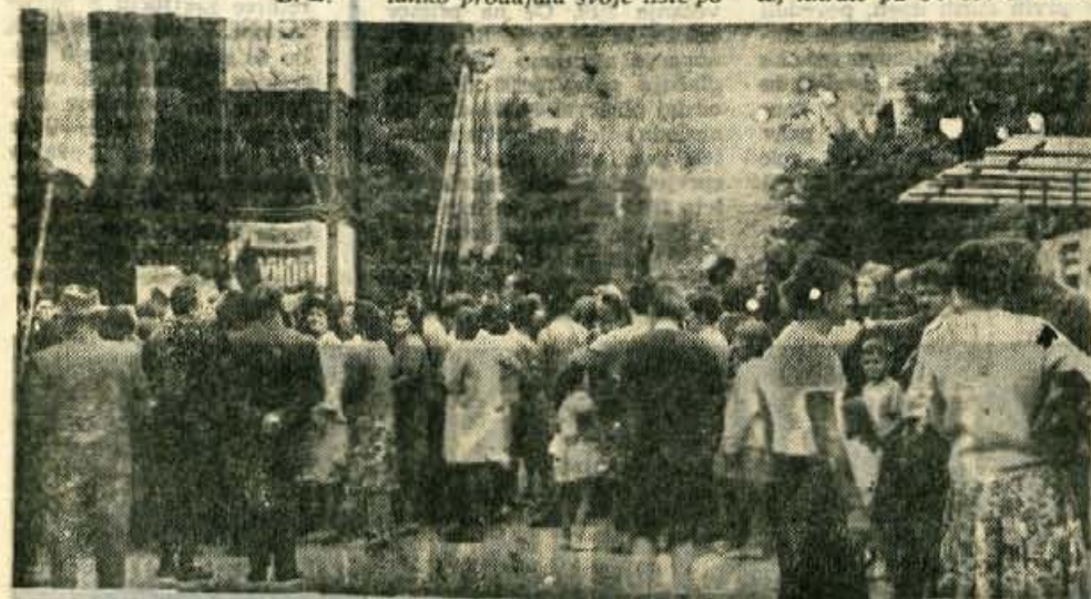
Kljub slabemu vremenu je 15. jubilejni Gorenjski sejem obiskalo do ponedeljka večer že 22.400 ljudi

Skopje, 3. avgusta — Včeraj so v glavnem mestu Makedonije odprli tradicionalni skopski sejem vzorcev, izdelkov in reprodukcijskega materiala. Na sejmu sodeluje z okoli 3200 razstavnimi predmeti nad 120 razstavljalcev.