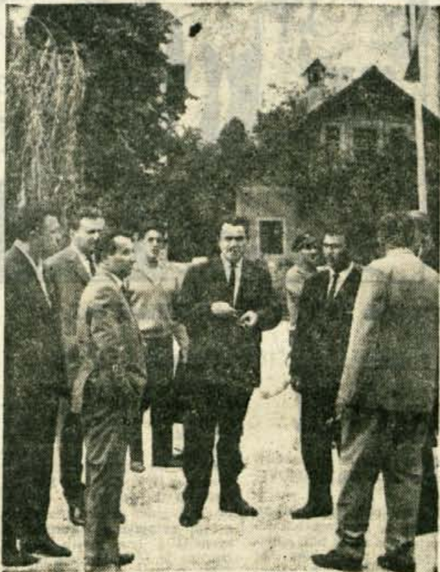
Gostje pred otvoritvijo vodovoda v Zalogu

razširitve vodovoda Kranj z okolico je iz zbiralnega rezervoarja Trata usmerjen glavni vod proti Srednji vasi, kjer se pred vasjo razcepi in usmerja glavno vejo proti vasi Britof in preko Primškovega do stolpnega rezervoarja v Kranju, z drugo vejo pa preko Senčurja in dalje proti vasem Voglje-Voklo-Probačevu do rezervoarja pri Smedniku. Ko bo dograjeno in priključeno celotno planirano omrežje tudi na levem in desnem bregu Save, ne bo z vodo več takih težav, kot jih marsikje danes še imajo!