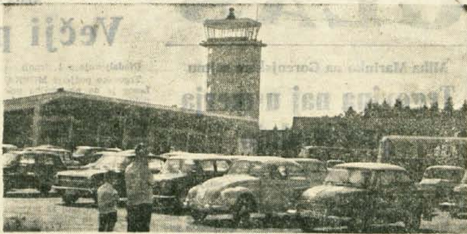
Ze večkrat smo poročali, da je letos precej večji obisk gostov po naših turističnih krajih kot lani, čeprav doslej nismo imeli sreče z vremenom. Precejšen prispevek k temu uspehu pa je brez dvoma tudi novo letališče Brnik, kjer je vodna vrsta vozil v čakalju na odhod ali prihod po »zračnih cestah« iz raznih krajev Evrope

Jabolka 200 do 250 din, hruške 300 din, breskve 280 do 340 din, marelice 300 din, fige 350 do 400 din, solata 160 do 200 din, krompir 80 do 90 din, zelje 70 do 80 din, rdeča pesa 150 do 160 din, korenček 180 do 200 din, med 800 din, surovo maslo 1500 din, skuta 400 din, gobe jurčki 800 din, paradižnik 200 do 250 din, paprika 500 din, fižol v stročju 200 do 240 din, kumare 160 do 200 din, kaša 200 do 220 din za liter, ješprenj 170 do 180 din, koruzna moka 140 din, ajdova moka 200 do 240 din, pšenica 80 do 90 din, oves 50 do 60 din, borovnice 220 do 240 din, lisčke 120 do 140 din, kokoši žive 800 din, jajca 50 do 55 din komad.