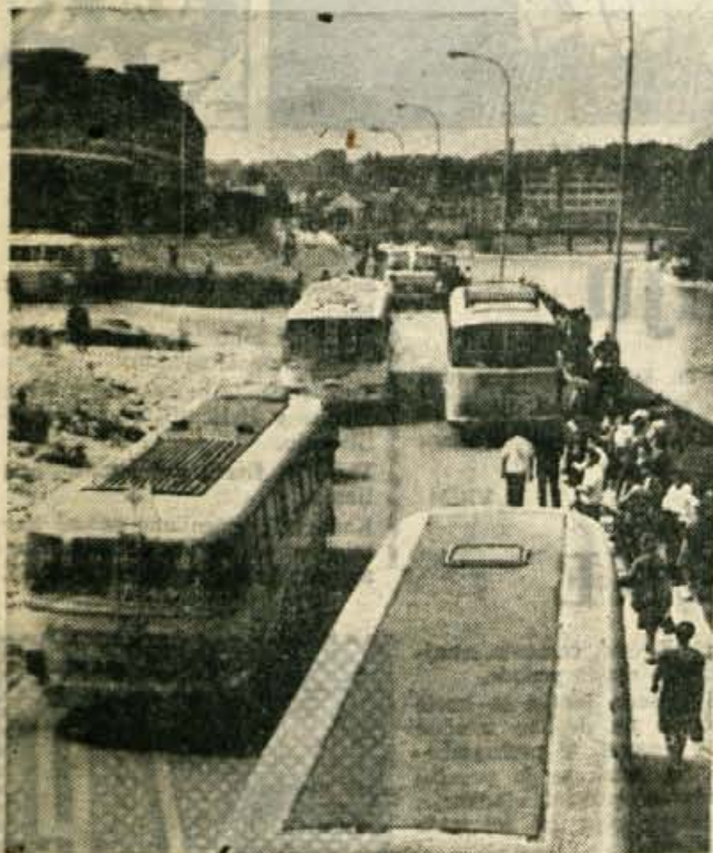
Kranjske ceste so vse bolj ozko grlo. Zlasti ob tako imenovanih prometnih konicah, katerim se v sedanjem času pridružijo še ves mednarodni tranzit skozi Gorenjsko. Prizor iz ceste pri Savskem mostu