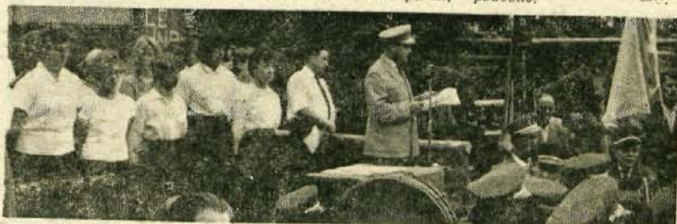
Posnetek s proslave na Zirovskem vrhu. Levo skupina škofjeloških gimnazijcev, ki so prireditelji pripravili lep kulturni program

namene postavljen ličen paviljon na najbolj izpostavljenem mestu, ob Kazini. Zal je notri moč dobiti vse drugo, samo sadja zelo malo. Trgovsko podjetje Agrarija, ki je sicer prevzelo ta lokal, obljube ne izpolnjuje. Gramofonske plošče z našo narodno glasbo so na Bledu začeli prodajati šele 20. junija. Skratka so to problemi, ki so vsem poznani a jih ne znamo in ne znamo odpraviti. J. P.