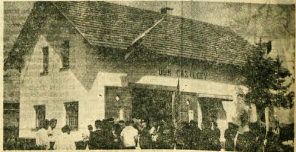
Kot smo že poročali, so preteklo nedeljo v Prebačevem odprli nov dom gasilcev. Hkrati so na domu odkrili ploščo enajstim med NOV padlim domačinom iz Prebačevega in Hrastja

Načrt, ki smo si ga ogledali, predvideva zelenice, dohode in veliko drevja, odnosno lepotnega grmičevja. Domenjeno je, da bo predlog o vrsti drevja in grmičevja dalo hortikulturno društvo. — B. B.