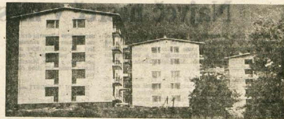
Na ono stran Tržiča, ob avtomobilski cesti, gradijo novo stanovanjsko naselje. V avgustu bosta vseljiva prva dva bloka, naslednji pa konec septembra. Koj nato bodo začeli graditi še dva nova

Patronažne sestre delajo vsaka na svojem terenu, ki obsega okoli 4.500 prebivalcev. Pri delu se srečujejo z najrazličnejšimi problemi, katere morajo reševati same ali pa v sodelovanje z ustreznimi službami. Največ se bavijo s sistematičnim varstvom rejence, dojenčka, malega in predšolskega otroka ter tuberkuloznega bolnika.