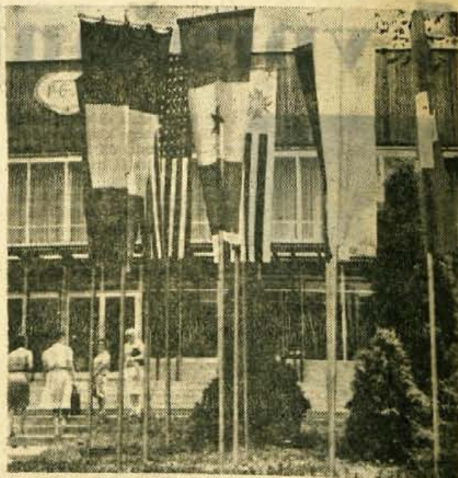
Slika prikazuje Festivalno dvorano na Bledu, v kateri je bil 33. kongres PEN klubov

Skratka, Bled in slovenski odbor PEN kluba sta z uspehom opravila zrelostno preizkušnjo velikega obsega. Jože Bohinc