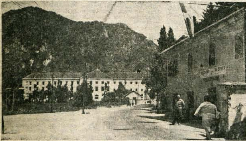
Begunje — pogled na bolnišnico, med vojno zloglasne nemške zapore