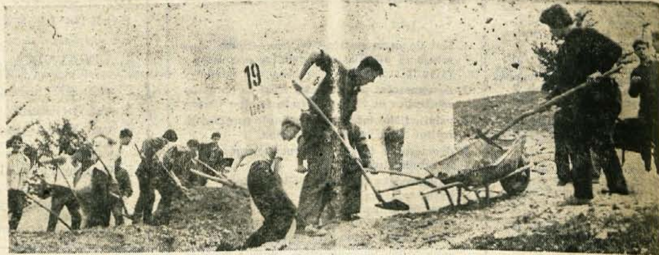
Od 21. junija do 22. avgusta bodo brigadirji iz Ljubljane, Jesenic in Svedske na Planini pod Golico urejali smučišča ob žičnici na Španov vrh in cesto z Jesenic do Planine pod Golico. Reportažo o njih boste lahko brali v sobotni številki.