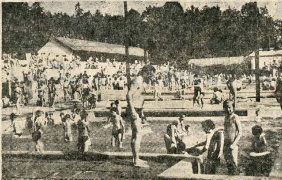
V sedanjem atomskem času je tudi vreme postalo muhasto. Letos smo kar v tednu časa zamenjali plošče s kopalkami. In kakšna vročina! Kopališča — urejena ali ne — so povsod polna (posnetek iz Kranja)