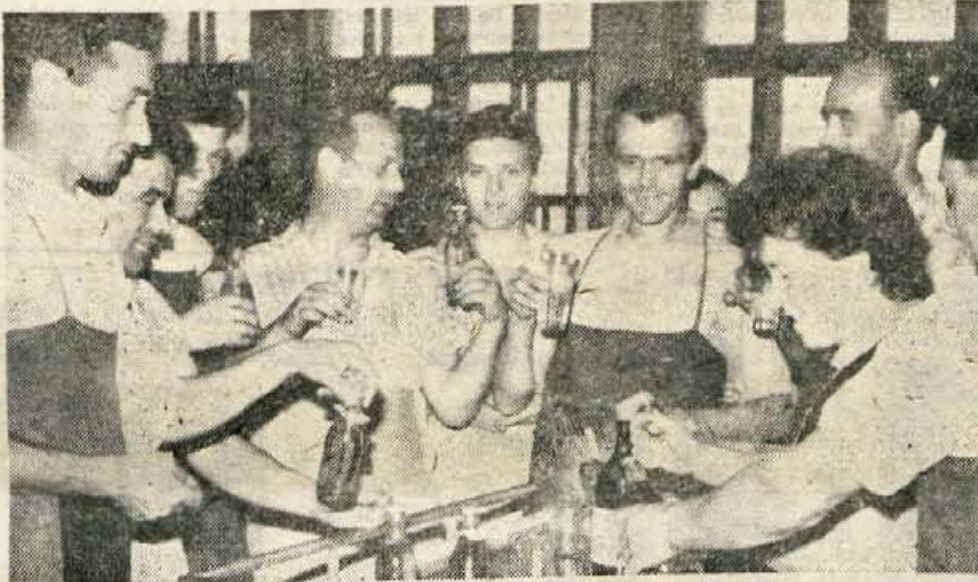
Za izmenjavo misljenj in stališč niso samo organizirani sestanki, marveč vsaka priložnost prostega časa. Težav je pa povsod veliko. Tudi ob malicah (posnetek iz menze v Alpini — Ziri) delavci v sproščenem ozračju povedo vse kar mislijo

podobnih posvetovanj, so dali pritrilne odgovore, le da so predlagali, naj bodo ta organizirana po posameznih področjih, ker bi se na njih lahko še bolj konkretno pogovorili o problematiki ne samo posameznih panog, ampak celo posameznih podjetij. To je težnja predvsem manjših delovnih organizacij, ki na podobnih seminarjih ali posvetih, spričo problemov velikih podjetij, dostikrat ne pridejo do polne veljave. — S. B.