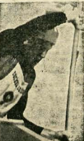
Boji kajakašev z deročo Savo v Tacnu so v nedeljo dali veliko užitka gledalcem

V tekmovalju ekip v roketu je zmagala ekipa iz Postojne.