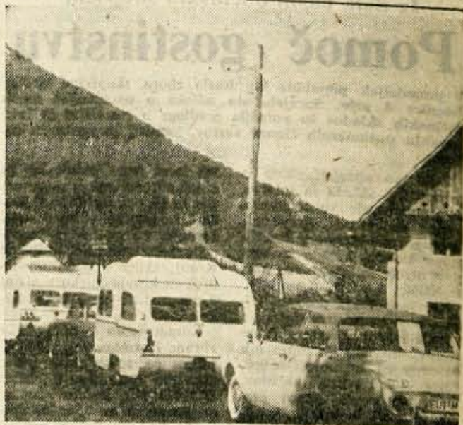
Kljub letošnjemu slabemu vremenu pa je promet inozemskega turizma letos še večji kot v prejšnjih letih. Skozí Kranjsko goro (na sliki) se vsakodnevno vijejo kolone tujih vozil

Oddaje sprejetih del za ocenjevanje emitirajo iz naših osrednjih televizijskih postaj kot navadno. Na Bledu pa je zbrana strokovna žirija, ki ta dela ocenjuje. Prav tako je festivalska dvorana opremljena z osmimi televizijskimi sprejemniki tako, da je dana možnost občinstvu na sploh, da sodeluje pri tej prvi skupni manifestaciji naše, mlade televizije. — K. M.