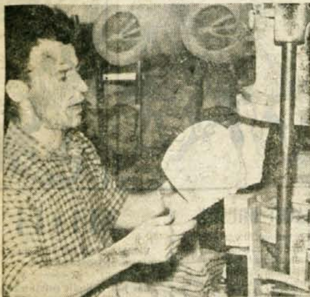
Ceprav pokazateji ekonomskih uspehov v zadnjih mesecih ne dokazujejo predvidenega napredka, pa delavci po škofjeloških kolektivih niso zgubili vero v samega sebe in so prepričani, da bodo premostili nastajajoče težave. Na sliki delavec pri oblikovanju klobukov v tovarni Sešir

Med osnovnimi vprašanji, ki jih bosta obravnavala je poročilo o zaposlovanju in nagrajevanju v gospodarskih organizacijah, za kar so prejeli odborniki že predhodno potrebni materiali. Nadalje bosta na dnevnem redu seje tudi poročila Medobčinskega komunalnega zavoda za socialno zavarovanje v Kranju za leto 1964 in poročilo Komisije za prošnje in pritožbe.