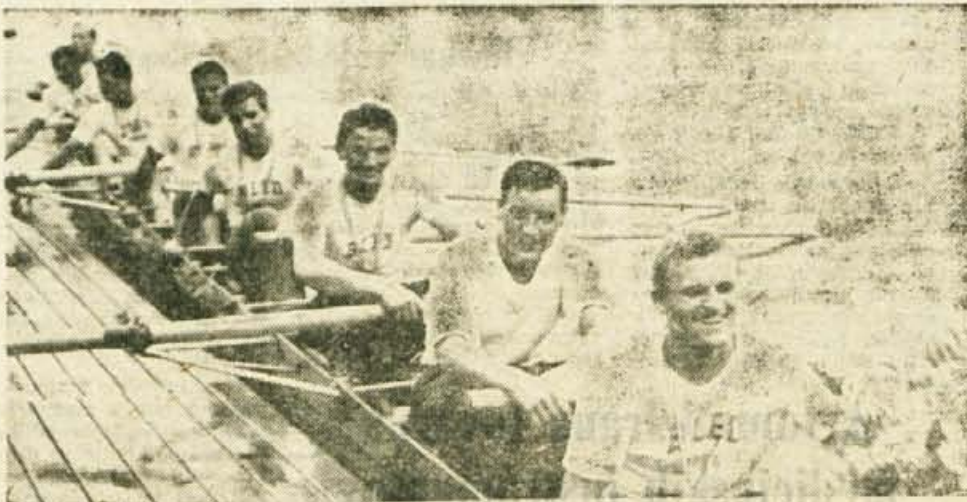
Na nedeljskem tekmovanju je nastopil tudi jugoslovanski osmerek, ki ga prikazuje naša slika

disciplinah: moški — četverec s krmarjem: 1. CSSR, 2. Jugoslavija, dvojec brez krmarja — 1. DR Nemčija, 2. Jugoslavija, četverec brez krmarja — 1. Jugoslavija, skiff — 1. ZS, dvojec s krmarjem — 1. CSSR, 2. Jugoslavija, double scull — 1. Romunija, 3. Jugoslavija, osmerek — 1. Jugoslavija; ženske — skiff — 1. Sokolova (Bolgarija), 2. Humski (Jugoslavija) — mladinci — skiff — 1. Majstrovic (Jug.) double scull — 1. Crvena zvezda, osmerek — 1. Trešnjevka, 2. Bled, četverec s krmarjem — 1. Krka. — J. J.