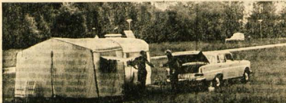
Neugodno vreme je letošnja turistično sezono na začetku dokaj zavrlo. Vendar se na Bledu, pa tudi v drugih turističnih krajih, že vidi vse več inozemskih gostov. Tudi v dobro urejenem campingu v Zaki ob blejskem jezeru so se pojavile prve lastovke turistične sezone

Turizem pa bo nujno razvijati tako, da bo zadovoljeval željam tujih in domačih gostov, tj. tistih, ki lahko trdijo, da imajo omejene možnosti. Vzoredno z izboljšanjem kvalitete in uslug turističnih objektov samih pa se mora dvigniti tudi urbanistični standard naselij, obseg možnosti za športno rekreacijo, razvedrilo in zabavo, kajti danes imajo gostje od tega le malo na razpolago. — U.