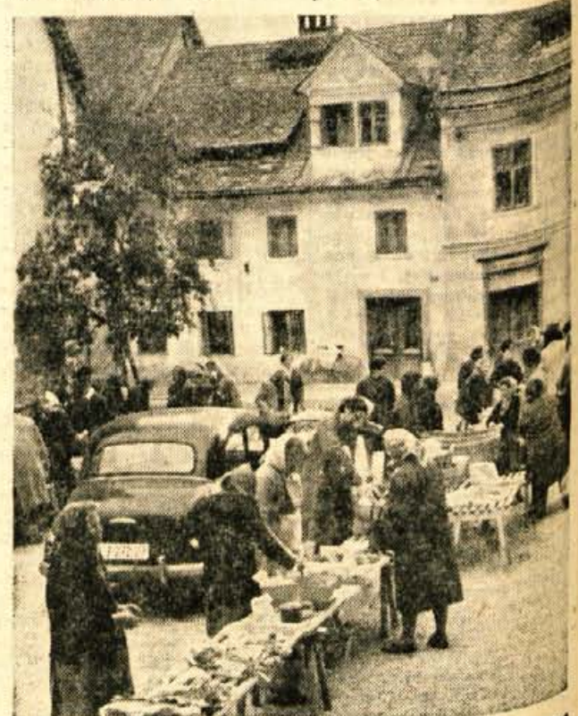
Skofjeloska tržnica je zelo dobro obiskana. Toda gospodinje ne pritožujejo, da tam ni najti stvari kot bi želele. Ne najdejo piščancev. — suhe robe« in mnogih drugih potrebščin, kot je to v Kranju in drugod

Vzporedno s to gradnjo pa gradijo tudi park padlih borev in žrtev fašizma. V ta park bodo postavili in na svečan način odkrili tudi spomenik oz. spominsko obeležje. — R.