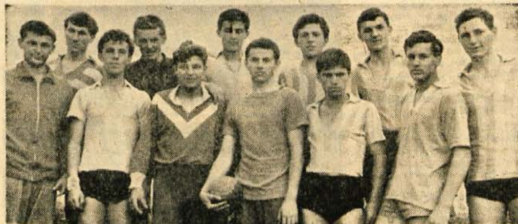
Prihodnost pripada mladim. To se je najbolj pokazalo pri letošnjem rokometnem tekmovanju ko je mlado moštvo Kranj B osvojilo prvenstvo v tej športni disciplini na Gorenjskem

Prvakinje so pokazale odlično igro in so nasprotnice popolnoma nadigrale ter so tako igro lahko uvrstile tudi v republiško ligo. P. S.