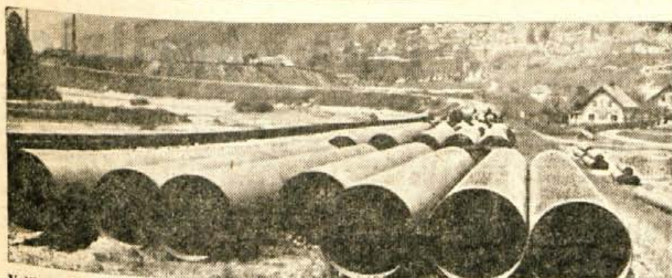
Velika nova valjarna na Belškem polju potrebuje tudi veliko tekoče vode za hladilne naprave itd. Zato so v jeseniški železarni napravili posebne železne cevi, po katerih bo tekla voda nad 3 km daleč iz Stare Save do nove valjarne