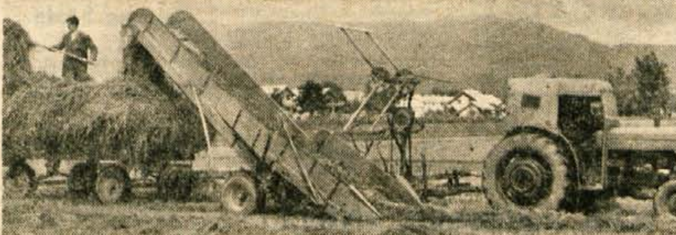
Ceprav hladno in deževno vreme nič kaj ne kaže, vendar je tu že junij in čas košnje. Toda sodobna mehanizacija je tudi pri nas že močno spremenila prizore nekdanjih koscev in grablje po seno. Stroj, ki ga vidimo na sliki, pograbi in hkrati naklada na voz. V tem primeru gre za sveže krmo bodisi za vsakodnevno krmiljenje ali pa za silažo. Prav tako pa ga uporabljajo lahko za suho seno. Letos imajo 6 takih »koscev«.

Kranj, 1. junija — Svet za kulturo in prosveto pri občinski skupščini je zbral gradivo o delu Prešernovega gledališča v Kranju in pripravil prvo razpravo, ki bo dana na seji tega organa. — Osrednji cilj je, da bi samo občinstvo, potem pristojni organi in končno občinska skupščina izrekli svoj da ali ne za ponovno ustanovitev poklicnega gledališča v Kranju. Razprave in različna ugibanja o tem so žive od ukinitve te ustanove pred 8. leti sem. Toda nikdar se za to ni zavzel nek odgovoren organ občine ali okraja (takratnega) in vse je ostajalo le pri razpravah. Tokrat je predvideno več posvetov z ljudmi, ki se bavijo z gledališkimi problemi, razgovori neposredno z občinstvom in podobno, kar bi dalo možnost oblikovanja dokončnega stališča, o katerem bi razpravljala občinska skupščina. — K. M.