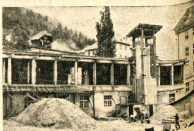
Deset in desetletja so na Golniku razširjali le prostore za osnovno dejavnost zdravilišča. Zato v zadnjih letih zidajo stanovanja, urejajo družabne prostore in okolico. K tem naporom sodi tudi ureditev osrednje kuhinje, ki je trenutno največja investicija v tem zdravilišču

Kljub temu, da se to zdravilišče odmika od nekdanje osnovne dejavnosti, zdravilne pljučne tuberkuloze, pa ima v prihodnje lepe perspektive. To mu omogoča tradicija, ugodno podnebje in še posebno osposobljen zdravstveni kader. Zato se počasi preusmerja v specializirani rentgenski center za vse prave bolezni in podobno. K. M.