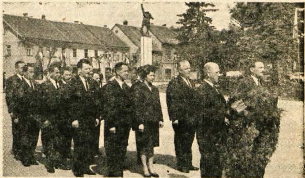
Na slovesni seji občinske skupščine Kranj je bila imenovana delegacija predstavnikov vseh družbenih in političnih organizacij, ki je ob zvokih »Kot žrtve...« položila venec pred spomenik revolucije na istoimenskem trgu