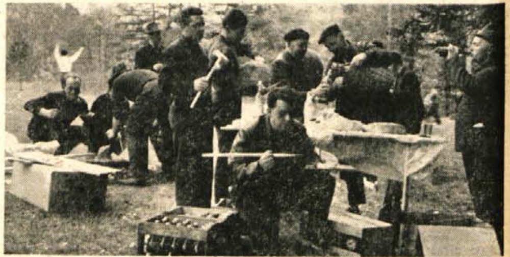
Razen mnogih slovesnosti, kómemoracij in drugih prireditev, so praznik zmage ljudje praznovali tudi v ožjem krogu. Na sliki: skupina jeseniških železarjev, ki je skupno z Američani monterji nove bluming valjarne na Belškem polju, proslavljala v Završnici. Seveda ob čopapčeti in domači kapljici

S tem je kolektiv Tekstilindusa v resnici pokazal ne-