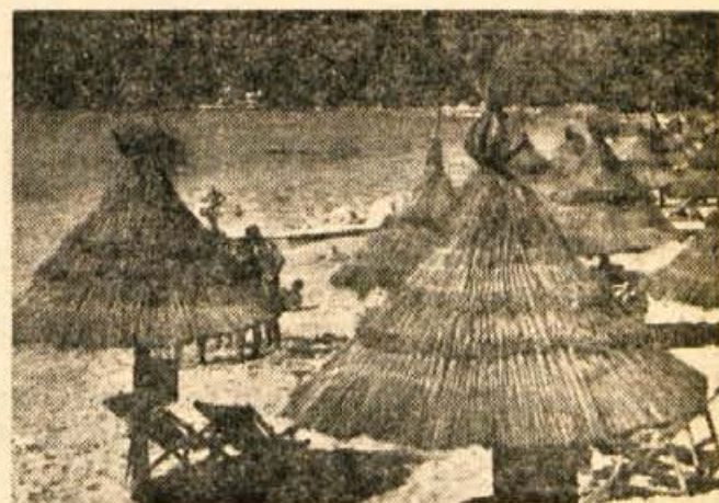
Tudi pri nas se bo kmalu pričela sezona sončenja in kopanja. Zanimivo je pogledati kako so uredili plažo v Mallorci v Španiji: poceni in obenem estetsko zelo lepa rešitev.

Znanstvenik trdi, da bi bili uničeni celotna Rusija in Amerika, četudi bi uporabili le desetino vsega razpoložljivega orožja. Po njegovem mnenju ima v tem pogledu