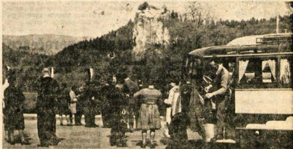
Turistično razpoloženje na Bledu je letos oživel prejšnje kot navadno. Poleg ugodnega vremena so k temu prispevali tudi prazni

Daljnovod za dovod električnega toka v valjarne na Javornku je tekel preko Belskega polja. Zaradi izgradnje nove bluming valjarne je bilo treba kabel položiti po drugi trasi. Da ne bi zaradi prekinitve električnega toka trpela proizvodnja, so prenos izvršili 1. maja, ko valjarne niso delale. Nad 200 prostovoljcev je nosilo in vleklo kabel na novo traso. Ta dan so izvršili tudi prekop žic visokonapetostnega daljnovoda. Delo so zaključili pred predvidenim rokom.