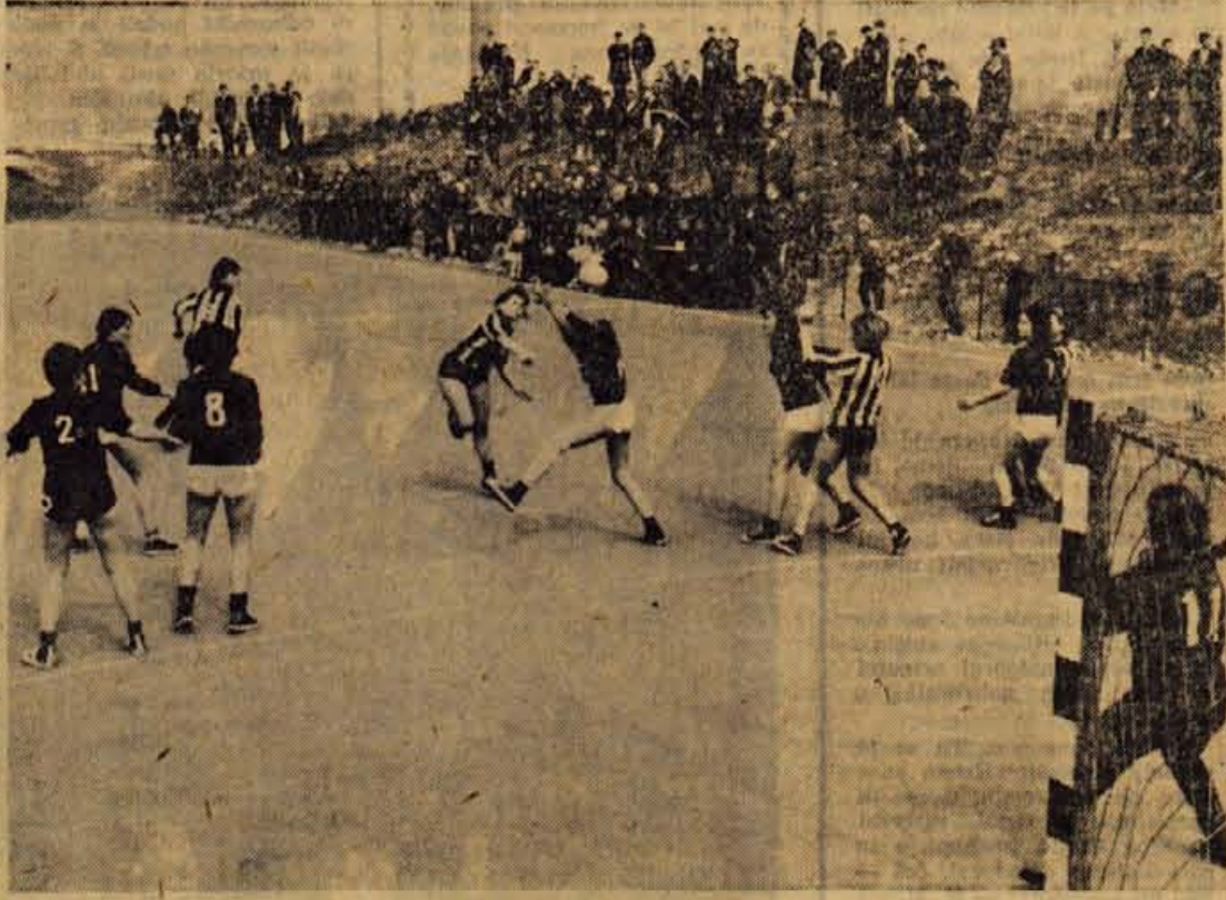
Slika prikazuje rokometiške pri igri v Stražišču