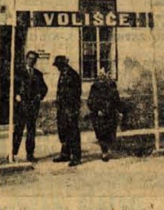
Ljudje so marsikje dali duška svojemu volilnemu razpoloženju z okrasitvijo in tradicionalnimi mlaji