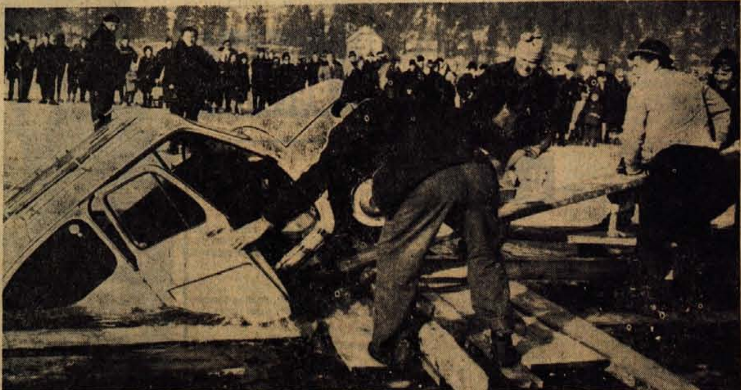
V soboto je napolnil dolgo pričakovani trenutek: s pomočjo potapljača so z dna Blejskega jezera dvignili potopljeni avtomobil. Tako je bil zaključen prvi dogodek take vrste, ki se je pripetil na Bledu. Obširnejše poročilo o tem berite na 2. strani

je takih. Ti pa kolneš čez socializem. Sam si pomagaj! Socializem je za tiste, ki delajo.« Tako je povedal. Vsi so utihnili. Prizadeti možak srednjih let in z dolgimi lasmi preko čela je vstal, se majavo ozrval, prijel steklenico piva, ki je bila na pol izpraznjena in jo treščil na tla s tako silo, da so se drobci razleteli daleč naokrog. Pribitela je natakavica, zahtevala naj plača, on pa je še bolj vzroban-til, klel in odšel. Se na cesti so ga opazovali ljudje, kako je mahal z rokami in preklinjal vse, kar mu je prišlo na misel. K. M.