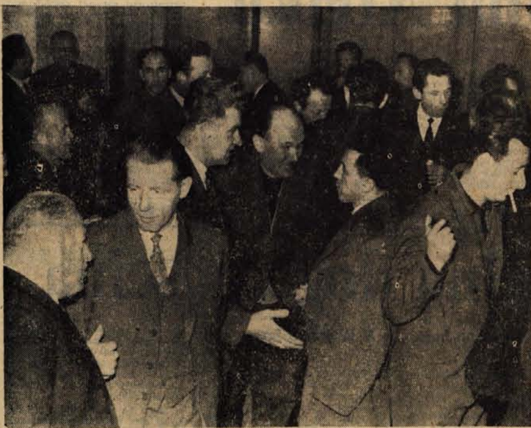
Odborniki občinske skupščine Skofja Loka v odmoru med živahno diskusijo o osnutku proračuna