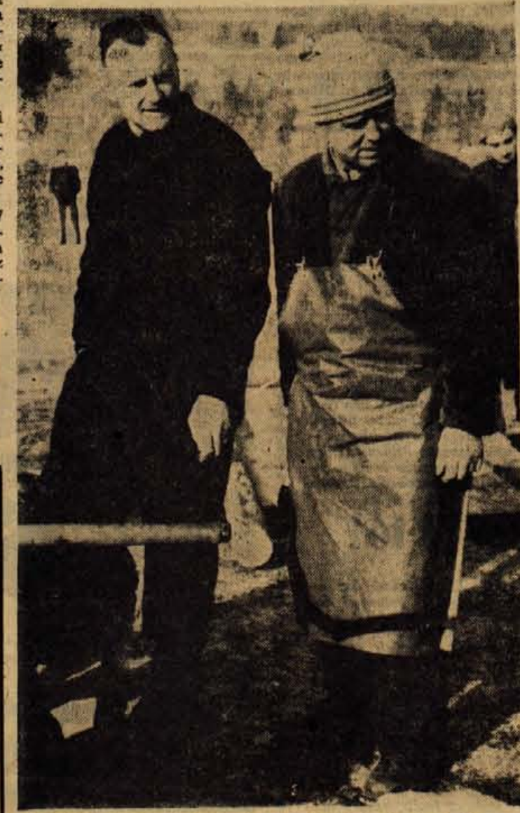
Lastnik potopljenega Fička in domačin Jezernik sta imela razen potapljača pri reševanju glavno besedo