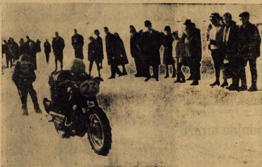
Letošnjo zimo Bled še ni doživel tolikšnega obiska kot preteklo nedeljo. Glavna privalčnost: zaledenelo jezero, sončno vreme in zanimivo tekmovanje

● iz naših komun ● iz naših komun ● iz naših komun ● iz naših komun ● iz naših komun ● iz naših komun ● iz naših komun ● iz naših komun