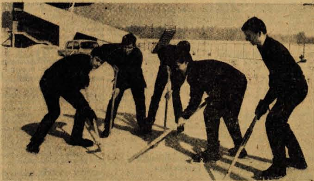
Kmalu za tem, ko so ob kranjskem stadionu uredili manjše drsališče (služilo bo nekaj let, da bo zgrajeno novo — stalno so se tu začeli zbirati ljubitelji hokejskega športa. Mnogi se navdušujejo tudi za hokej. Zazeleno bi bilo, da bi začetniki športa na ledu dobili tudi svojega učitelja

NA BLEJSKEM JEZERU — je bilo minulo nedeljo veliko gostov kot doslej še nikoli. Privabila jih je zanimiva športna prireditev z motorji in smučarji. Motornih vozil je bilo skoraj tisoč. Polna so bila vsa parkirišča in tudi na cestah je bilo povsod dovolj motornih vozil. Ljudje so se zbirali okrog tekmovalne steze in se sprehajali po zmrznjenem jezeru. Mnogo gledavcev pa je opazovalo tekme kar z obale, s plačadmi kazine, gradu in z drugih razglednih krajev. Bled je torej doživel rekordne obiske nedeljskih gostov prav sredi zime.