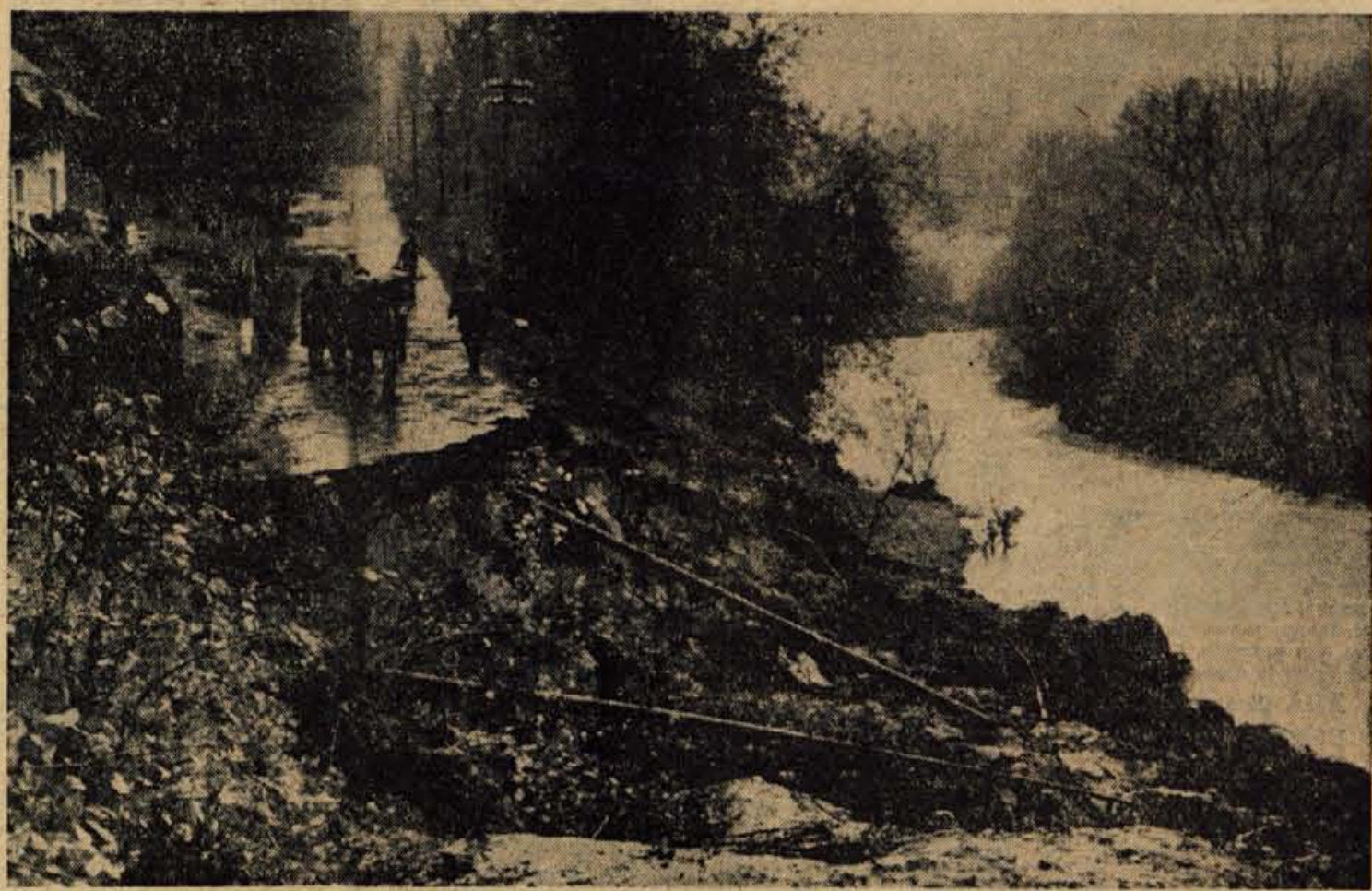
Hudo deževje v Sloveniji in Hrvaški

Reelekcija ni zgolj formalnost. To ni seveda niti osebno obravnavanje med ljudmi. To je družbeni proces, ki je ena izmed osnovnih postavk naše ustave in drugih naših pomembnih družbenih dokumentov. To je torej kazipot za akcijo vseh naprednih družbenih sil.