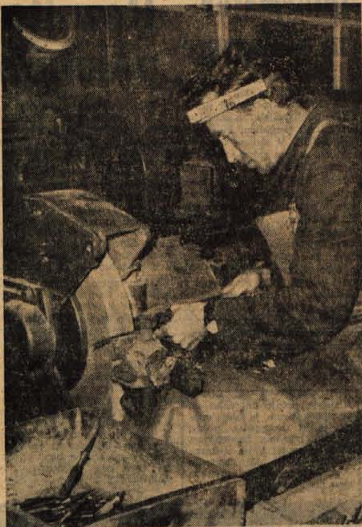
Mizarsko dielo iz tega brusilnega stroja v Tovarni kos in srpov v Trčiču bo dobilo dokončno podobo še v lakirnici

V jeseniški železarni je že nekaj let klub mladih proizvajalcev, ki ima za leto 1964-65 posebno bogat program dela. Mlade člane kolektiva bo seznanil z bogato tradicijo železarstva v jeseniški kotlini oz. njenim nastankom od fužin v Bohinju do Savskih jam nad Jesenicami. Da bodo spoznali mladi proizvajalci celoten krog proizvodnje, bodo organizirali medsebojne obiske med ekonomskimi enotami. Proučevali bodo tudi socialne probleme na Jesenicah in njihove vplive na proizvodnjo ter psihologijo dela in medsebojne delovne odnose na posameznih delovnih mestih. Prav posebno pozornost pa bo ta klub posvetil novogradnji na Belškem polju — kamor bo organiziral več strokovnih ekskurzij — vlogi raziskovalnega oddelka in njegovemu vplivu na kvaliteto proizvodov itd. Baval se bo tudi s podrobnimi študijami rekonstrukcije plavža, žične valjarne ter s problematiko in reorganizacijo nekaterih obratov in oddelkov. Delovanje kluba bo v letošnjem letu lep prispevek k strokovni izpopolnitvi mlajših članov delovnega kolektiva jeseniške železarne, kar zahteva rekonstrukcija podjetja in kar je v sklopu priprav na bližajočo se stoletnico obstoja in uspešnega delovanja ter velikega razvoja železarne Jesenice.