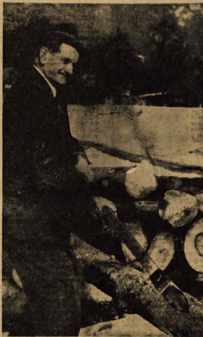
Teško delo pri pripravi lesa