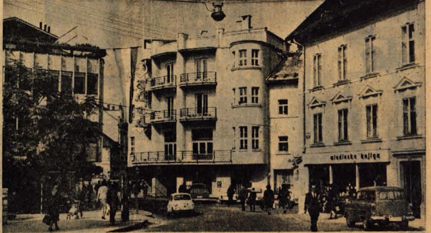
Po organizacijah SZDL v jeseniški občini

Ze dolgo časa je bila za Žiri v Poljanski dolini težava zaradi ne-higienične pitne vode. To so pred časom pričeli reševati z gradnjou novega vodovoda. Do sedaj je bilo tu več vodovodov odprtega tipa, ki pa niso ustrezali higieni-skim zahtevam. Zanjeto za novi vodovod so zgradili v štiri kilometre oddaljenem studencu Osojnica. Rezervoar so napravili nad vasjo. Ta bo lahko imel 350.000 kubičnih metrov vode. Od zajetja do rezervoarja bodo položili 150-milimetrske azbestne-tlačne cevi, od tu naprej pa cevi s premerom 200 milimet-rov. Krajevna skupnost, ki je investitor tega vodnega objekta, je predvidela za gradbene stroške okoli 40 milijonov dinarjev. Po mnenju nekaterih pa bodo znaša-li stroški gradnje precej več. Ze letos bodo toliko dogradili, da bodo lahko priključili že celotno omrežje starega na novi vodo-vod. Ostalo pa bodo prihodnje leto nadaljevali. — J.J.