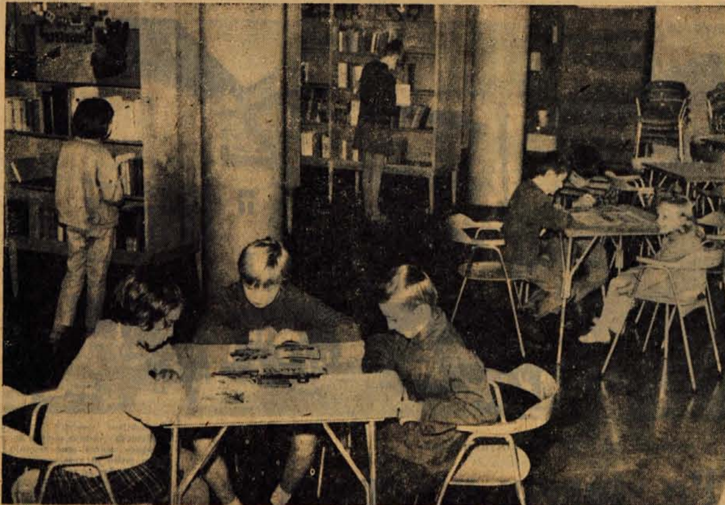
Pionirska knjižnica v Kranju je v zadnjih letih privabila mnogo mladih ljubiteljev lepe knjige in slikanice. Hkrati pa je knjižnica razvila široko dejavnost raznih krožkov in drugih oblik delovanja z malčki. Toda prostori so huda ovira za vse to in predvideno je, da bodo tudi pionirji dobili še druge prostore