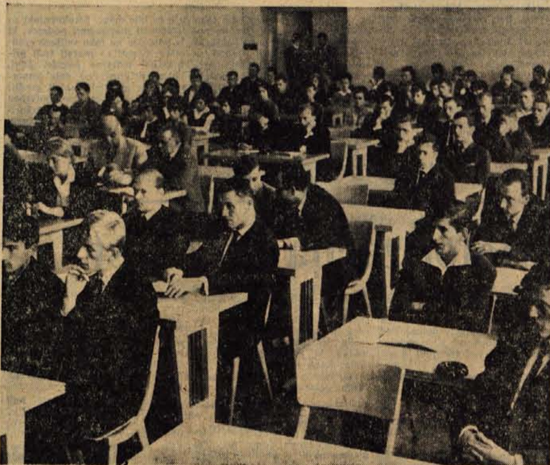
Mladina tovarne gumijevih izdelkov »Sava« iz Kranja na nedeljski mladinski konferenci.