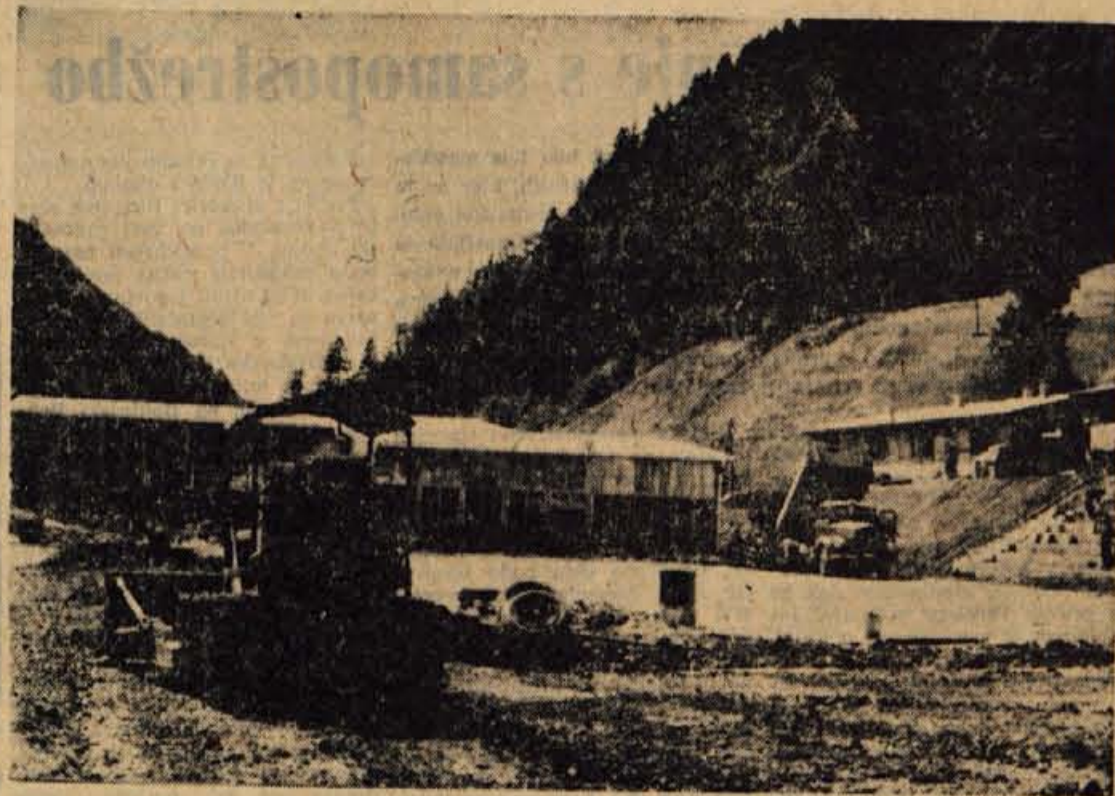
V soboto, 12. septembra, bodo tudi v Trzinu odprli novo šolo. Pred šolo pa gradbeno podjetje »Novogradnje« iz Trzina gradi novo rokometno igrišče in tribune. Z zadnjimi ureditvenimi deli zelo hitre, da bi bila tudi okolica šole kar najlepša.

Prav tako kot dohodki tako so tudi izdatki v skladu s predvidevanji. Čeprav so v prvem polletju 1964 v primerjavi z istim obdobjem preteklega leta za 57 odstotkov večji, pa kljub temu ne presegajo izdatkov, ki so predvideni po finančnem načrtu. Glavni vzrok za tako veliko razliko v odstotkih je predvsem zvišanje cen zdravstvenim storitvam za 15 do 20 odstotkov in za pet odstotkov več zavarovancev. Deloma je kriva tudi epidemija gripe v marcu in aprilu letos. Največ ljudi je zbolelo v Škofji Loki, kar se vidi tudi po številu bolniških dopustov. V Škofji Loki je bilo plačanih 32 dni, v Trzinu pa le 20. Vzrok je v tem, ker je bilo prav v škofjeloški občini cepjenih najmanj zavarovancev. Na skupščini so potem še razpravljali o spremembi pravilnika o načinu uveljavljanja pravic do zdravstvenega varstva in o drugih tekočih zadevah.