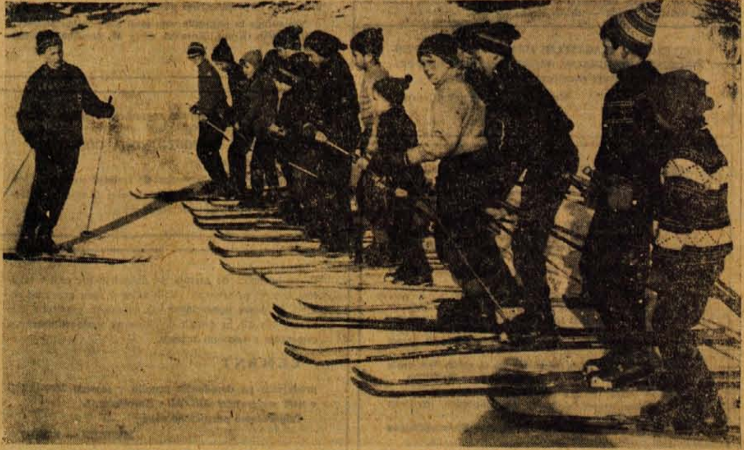
Osnovna šola »Lucijan Seljak« je na pobočjih Smarjetne gore pripravila smučarski tečaj za svoje učence. Ti so razdeljeni v šest skupin in nad vodstvom smučarjev vsak dan pridno vadijo smučarska veščina. Takih tečajev je, zaradi na vsaj Goravski na pretek

TRZIC, 22. januarja — V ponedeljek se je tu začel seminar za člane občinskega komiteja ZMS, člane komisij občinskega komiteja in za predsednike in sekretarje aktivov ZMS. Seminar se bo zaključil jutri. V ponedeljek so udeleženci poslušali predavanje »Jugoslavija v svetu«, v torek predavanje o naši novi ustavi, danes pa je na programu predavanje o naši delovni organizaciji. Jutri — zadnji dan seminarja — se bodo udeleženci seznanili z zgodovino Zveze mladine, z njenim statutom in programom ter podobnim. Zadnje temo bodo verjetno ponovili dvakrat. — P.