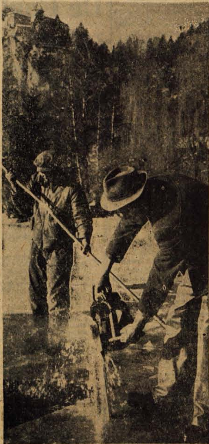
Na Bledu se vedno razveselijo ledu, saj pripravi dovolj zabave za domačine in privabi goste od drugod. Z ledom pa so tudi skrbi. Ugotovili so, da ledena ploskev ogroža obalo, ker jo pri širjenju dviguje. Zato žagajo meterski pas ledene ploskve ob obali od kopalnice do hotela Toplice. Zadnji čas to delajo z motorno žago. Led je v teh dneh debel 25 centimetrov.

Tudi za prometne zveze dveh sosednjih pokrajin vedno bolj skrbijo. S prvim februarjem bo s Trzinca začel voziti na Ljubelj do gostišča pri ljubeljskem predoru avtobus, ki bo zvezo vzdrževal dvakrat dnevno. Oba avtobusa bosta imela hitro avtobusno zvezo z Borovljami in Celovcem. Če poletje pa bomo imeli redno avtobusno progo med Ljubljano in Celovcem.