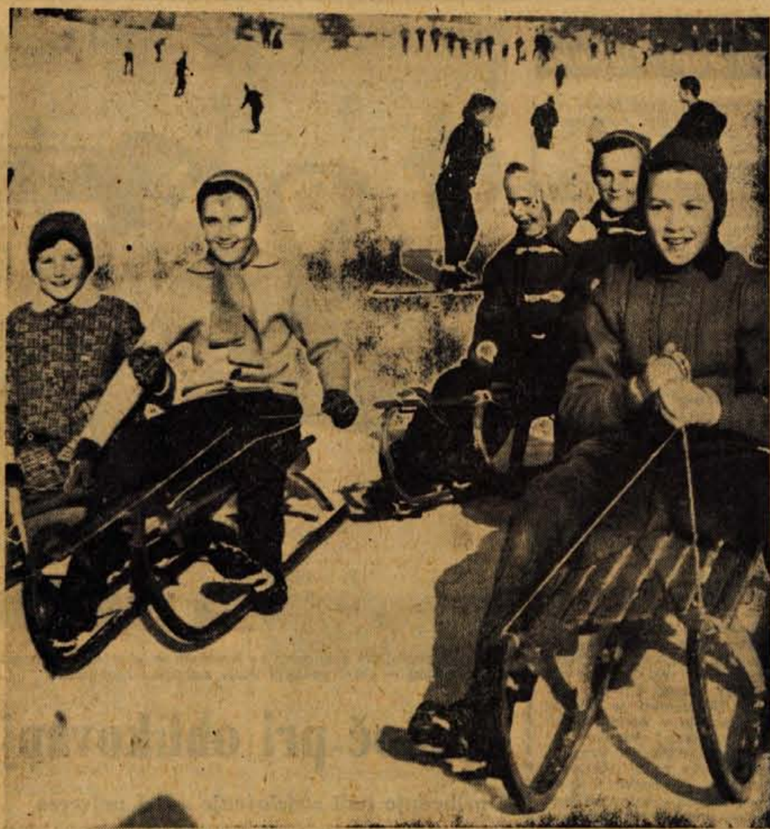
Na vseh bolj ali manj strmih ali položnih hribovih v okolici naselij je v teh dneh zelo živahno. Vsi, ki imajo počitnice bodo, kot kaže, prišli na svoj račun. Otrokom se tudi starejši radi pridružio (govorjenje o rekreaciji torej ni zaman).