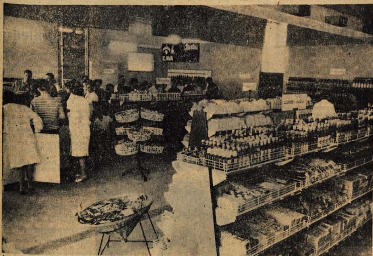
Nova samopostrežna trgovina na Hujah omogoča sodoben način prodaje, potrošnikom pa nudi pestro izbiro živilskega blaga