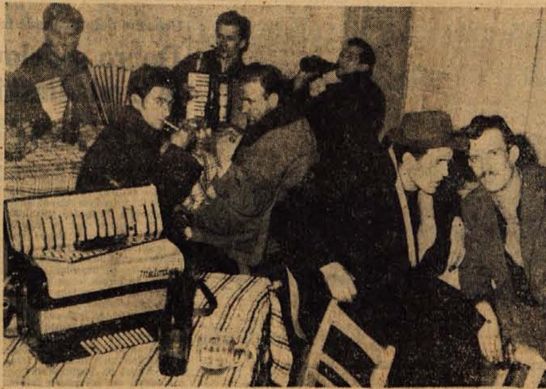
Na dan, ko jeseniški delavci prejemaajo mesečne osebne dohodke, je veselo po vseh gostištih.

V industrijskih krajih je plačilni dan že od nekdaj praznik, ki mu pravijo »Marija Geld«. Prva leta po osvoboditvi je bilo tudi na Jesenicah na ta dan kaj veselo. Kdor je le mogel, si ga je privoščil kozarec ali dva. Precej je bilo tudi takih, ki so naslednji dan »praznovanja« obžalovali, ker niso poznali mere. Jeseničani so se po nekaj letih odvadili nepotrebnega zapravljanja. Dobilci so nova stanovanja, ki so jih želeli opremiti, nabaviti električni štedilnik, hladilnik, pralni stroj ali celo avtomobil. Čeprav Jeseničani skoraj ne »praznujejo« več, je vsakega 15. v mesecu na Jesenicah še vedno precej veselo. Namesto domačinov praznujejo tuji, delavci iz sosednjih republik, ki jih je na Jesenicah nad 2.000. V sredo popoldne smo obiskali več jeseniških gostiln. Povsod je bilo veselo in skoraj po vseh gostilnah sva slišala petje. Najbolj veselo pa je bilo v Kazini. Vsi trije spodnji prostori so bili polni.