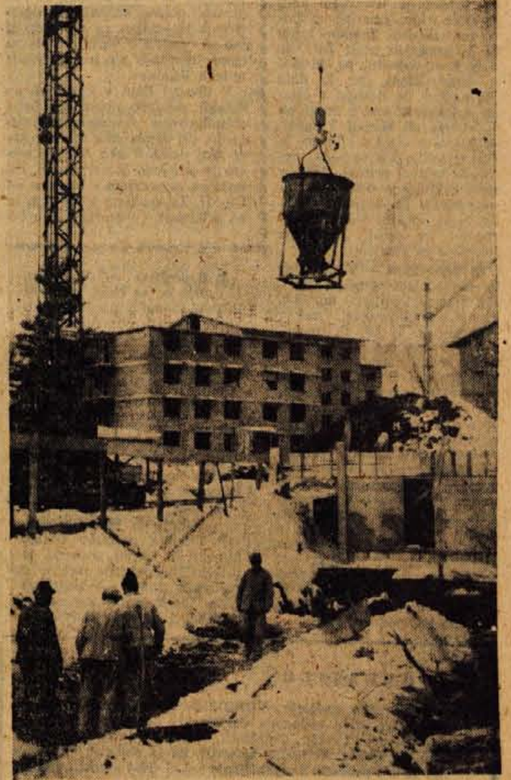
Tudi za sodnijsko poslopje v Kranju so za temelje predvideli tako imenovane vodnjake, kakršne so prvič uporabili pri gradnji stolpnice v Trzinu. Skopali in napolnili z betonom bodo 38 vodnjakov, ki bodo globoki okoli 10 metrov, do trdne podlage. Za tako delo je pripravljen zimski čas.

Smučišča Zelenice imajo to dobro okoliščino, da so zelo prostrana, sezona traja 5—7 mesecev in so primerna tako za vrhunske prireditve v mednarodnem merilu, kot za nedeljske smučarje.