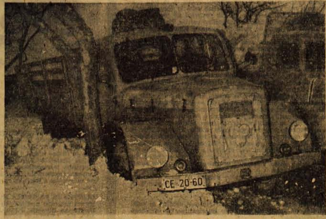
Na obvozni cesti med Naklem in Bistrico se je v sredo zjutraj tovorni avtomobil »kavalirosko« umaknil avtobusu in zaradi ozke ceste zdrknil za cesto. Mnoga srečanja večjih vozil se v zimskih dneh tako zaključujejo.

Približno uro po začetku poledice sta Cestni podjetji Kranj in Ljubljana cestnišče začeli posipati. Tako je zastoj v prometu na ljubljanski in na gorenjski strani trajal približno eno uro.