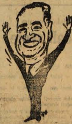
Naser - gostitelj arabskega vrha

V Kairu so se arabski voditelji sporazumeli o skupnem načrtu, po katerem bodo preusmerili največje pritoke reke Jordan in o tem, kako jih bodo izkoriščale obrežne države Jordanija, Sirija in Libanon. Trdnjena je ta načrt že izdelan in je naperjen proti Izraelskemu načrtu. V Kairu so razpravljali tudi že o udeležbi pri financiranju tega načrta. Na široko so razpravljali tudi o palestinskem vprašanju in o odnosih arabskih držav do Izraela. Po tem, kar je bilo rečeno v konferenčni dvorani, je videti, da Arabci pripravljajo dolgoročni načrt o skupni politiki vseh arabskih držav do Izraela. Za sedaj ni mogoče podati še neke točne ocene, vendar na slabo kaže, da bi se odnosi med Arabci in Izraelci v doglednem času popravili.