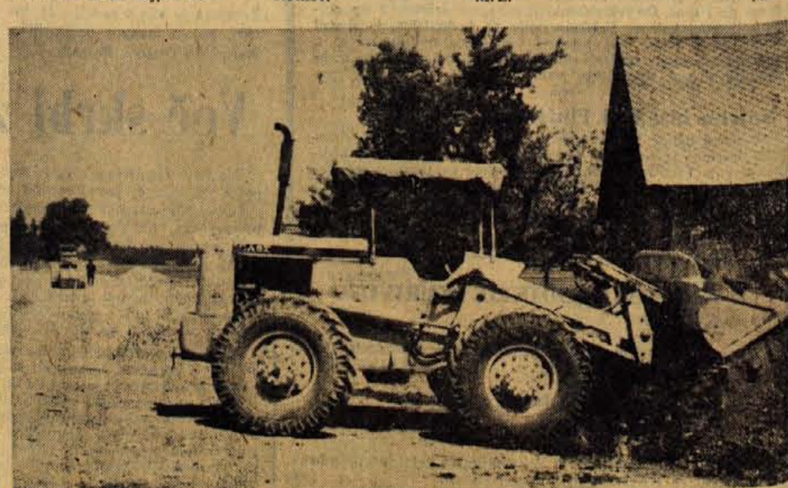
Graditelji odseka ceste Brnik-Ljubljana z delo zelo hitro, saj želijo kar najhitreje skrajšati ugodno cestno povezavo med Ljubljano in njenim letališčem

Največ delo bo imela komisija za komunalna vprašanja. Takol bo morala pristopiti k dokončni izgradnji avtobusnih postajališč na svojem območju. Urediti bo morala kanalizacijo v Podtaboru, Srednji vasi in v Dolenji vasi. To bo precejšnje delo, pri katerem bodo morali sodelovati vsi prebivalci. Nič manj pomembna ni naloga za ureditev okolice prosvetnega doma, izgradnja betonskih stopnišč in drugo. Polne roke dela bo imela komisija tudi s cestami in krajevnimi potmi. Le-te so sedaj močno poškodovane, zaradi njihove preobremenitve ob gradnji avtomobilske ceste Ljubelj-Naklo. Gre tudi za pomembna dela pri nadvozu nad cesto od nadvoza do Zej oziroma do ceste Naklo-Tržič. Dela na nadvozu hi-