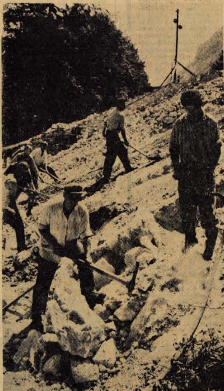
Kot kažejo dobre priprave in zgodaj začeta dela, bo na Jesenicah pokrito drsališče zgrajeno do roka — zime 1966. leta, ko bo v Jugoslaviji svetovno prvenstvo v bokeju na ledu. Tako lahko računamo, da bomo tudi pod Mežakljo lahko videli svetovno mojstre te športne igre.

V minulem tednu je imel novo izvoljeni svet krajevne skupnosti Besnica prvo sejo in je razpravljala o najvažnejših krajevnih zadevah, pred katerimi stoji ta organizacija. Prva naloga, kot so se zmenili, je na izgradnji vodovoda v Zgornji Besnici, dokončati obnovitev pokopališča, ureditev nekaj cest in potov in drugo.