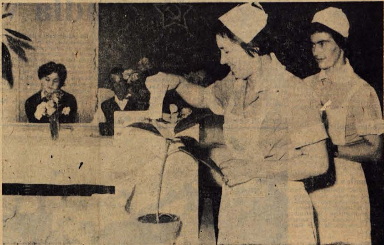
Seja upravnega odbora Gorenjske turistične zveze