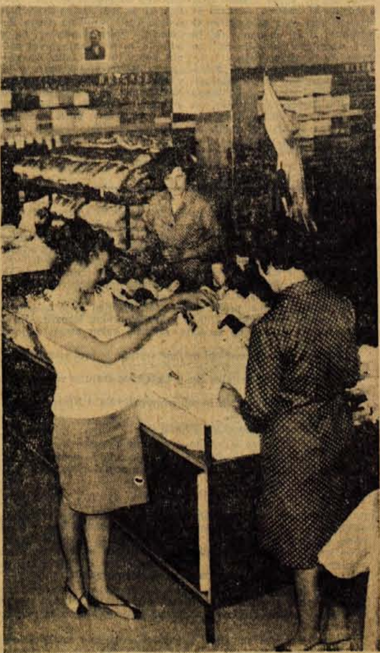
V novi prodajalni Murke Lesce

Trboje — V teh dneh so pričeli v Trbojah z preureditvijo krajevnega pokopališča. Nova ograja je v zaključni fazi, potem se bodo lotili še notranje preureditve in parka pred pokopališčem, v katerem bo kasneje stal nov spomenik padlim borcem NOV in žrtvam fašističnega terorja. — R.