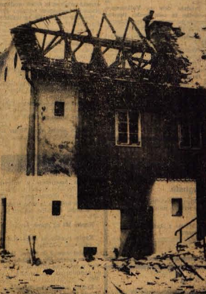
V Kranju so začeli podirati dvoriščno stavbo ob »Stari pošti«, katero bodo preuredili v upravne prostore in trgovino tovarne »Sava«

Dosedanji uspehi in program njihovega razvoja so zagotovilo, da bodo sredstva koristno vložena za razširjeno reprodukcijo. Tako bo iz skoraj likvidiranega Komunalnega podjetja zrastle novo, ki bo v korist in ponos cele občine. — ak.