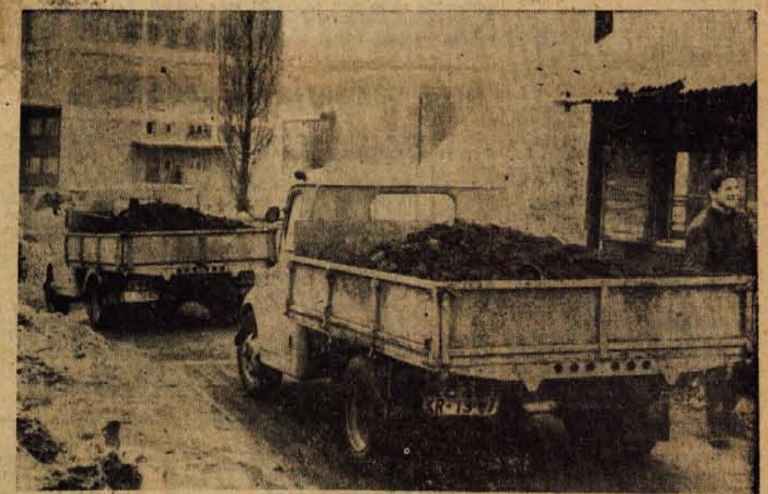
Ceprav z železniških postaj dan za dnevno odhajajo tovornjaki, naloženi s premogom, morajo mnogi potrošniki potrpežljivo čakati. Na sliki: pri tehtanju ob železniški postaji Kranj

Podjetja in ponekod tudi ekonomske enote imajo poleg obveznega sklada še svoj rezervni sklad. Nadaljevanje na 2. strani 2