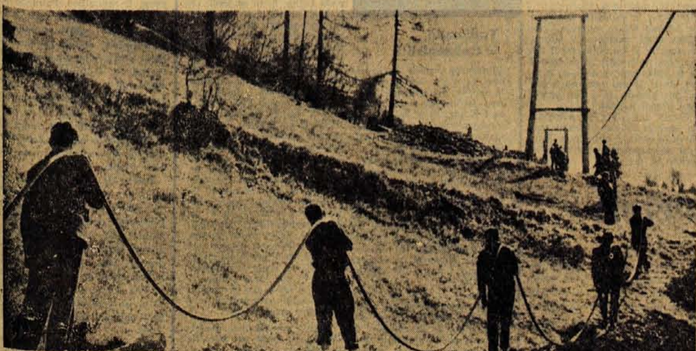
Dela pri gradnji žičnice na Črni vrh dobro napredujejo. Gradbenemu podjetju so ta teden prišli na pomoč dijaki jeseniške gimnazije, ki so položili električni kabel.

Glede na dosedanje ugodno poslovanje sklada za zdravstveno zavarovanje obstaja možnost, da ob polletju ponovno znižajo dodatni prispevek, ki ga plačujejo gospodarske organizacije za nadovrnene izdatke za zdravstvo. Lani je bil najvišji možni predpisani odstotek 4, za drugo polletje so ga znižali na 3,5, ob začetku leta pa na 3. Če prizadevanja za normalizacijo izdatkov za zdravstvo ne bodo popustila, obstajajo možnosti za popočno ukinitve tega prispevka. Samo lani so gospodarske organizacije na območju skupnosti kot dodatno plačale 400 milijonov dinarjev, kar se seveda nujno odraža na njihovem dohodku. — S.