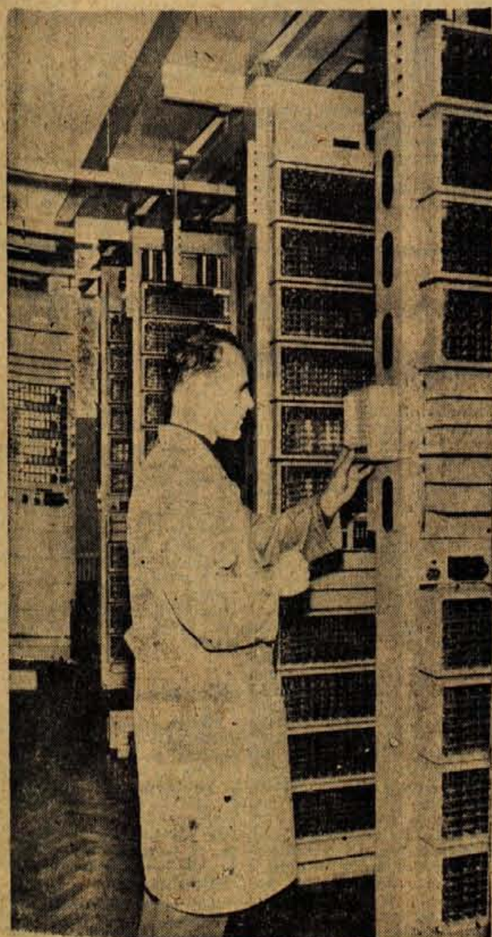
V petek bodo v Radovljici spustili v promet novo telefonsko magistralo od Ljubljane preko Kranja in Radovljice do Jesenic. S tem bo gorenjska popolnoma telefonsko avtomatizirana. Na sliki avtomatska telefonska centrala v Radovljici, kjer bo eno izmed glavnih vozlišč te magistrale

Na Jesenicah je bil na predvečer 1. maja koncert jeseniške in javniške Svobode, potem pa je bila v gledališču osrednja proslava. Prav tako so bile proslave in svečane seje tudi po drugih krajih Gorenjske.