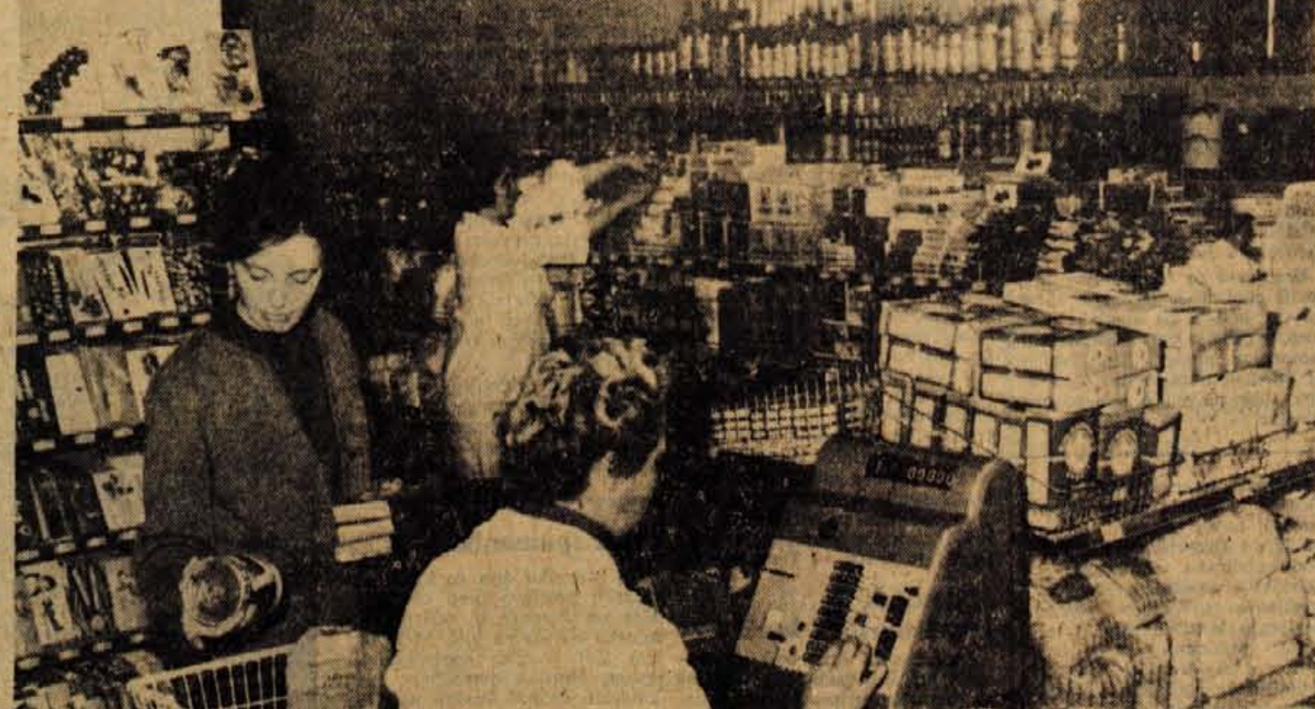
JESENICE, 24. aprila — Trgovsko podjetje Zarja na Jesenicah je od prlo poslovalnico Kašta. Prostor so adaptirali v stari Brnarjevi hiši, tako da so pridobili sodoben lokal z oddelkom za špecerijo in manu fakturo. Poslovalnica Kašta je bila prej na nasprotni strani ceste; prejšnje prostore bo železarna preuredila za svoje potrebe

Krajevna organizacija ZR Naklo se že nekaj časa marljivo pripravlja na praznovanje dneva borca. Poleg tega, da se bodo udeležili centralne proslave, ki bo letos na Jamniku, bodo odkrili tudi spominski obeležji dvema prvoborcema iz njihovega terena.