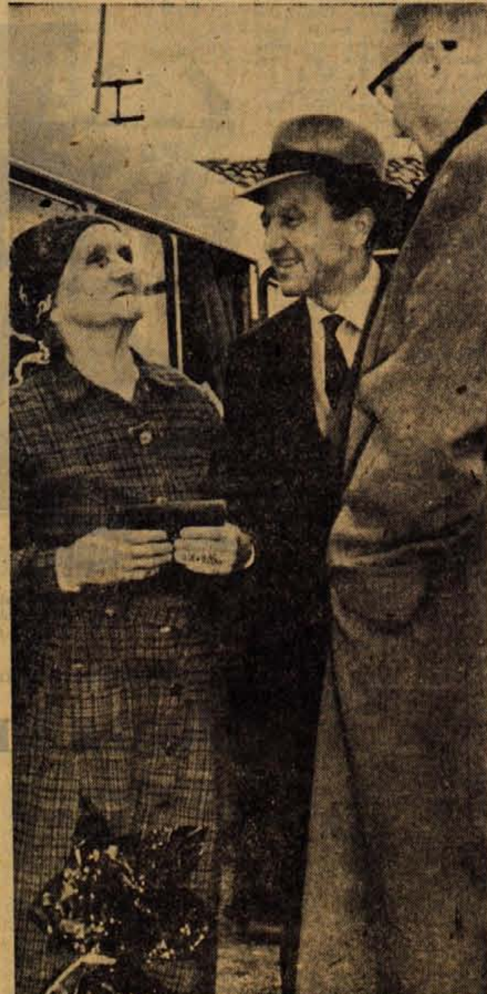
Predstavnika odseka za fluorografiranje inštituta za TBC Golnik v razgovoru z 82-letno partizansko mamico iz okolice Kozine, ki so ji na njeno veliko presenečenje izročili darilo kot trimilijontemu fluorografiranemu prebivalcu

Honorar po dogovoru. Nastop službe takoj. Ponudbe pošljite na Alpski letalski center Lesce.