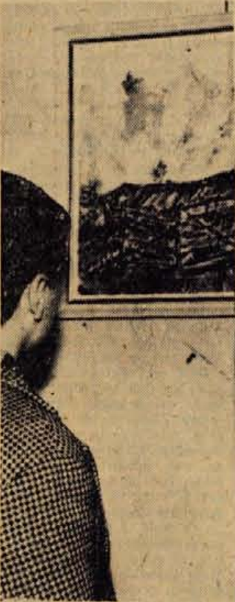
V avli metalurške tehniške šole na Resencah se druga za drugo vrste fasadne slikarskih del, katerih avtorji so mladi učenci te šole. Bodoči slikarji se urtijo v vseh tehnikah, prevladujejo pa oljna dela