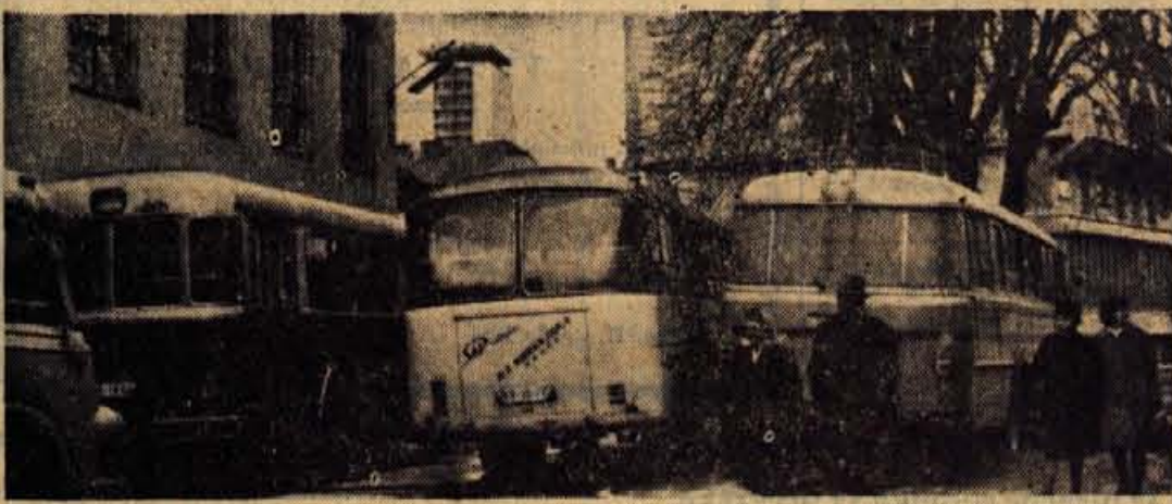
Največji promet v Kranju trenutno ni na cesti I. reda, ampak na stranski cesti za avtobusno postajo, kjer popravljajo del cestnišča. Z nenehnim na raščanjem avtobusnega prometa je ta del namreč postal ozko grlo

Realizacija količinske proizvodnje v prvem tromesečju je bila dosežena s 24,7 odstotki, v primerjavi z istim obdobjem lani pa presežena za 12,1 odstotka.