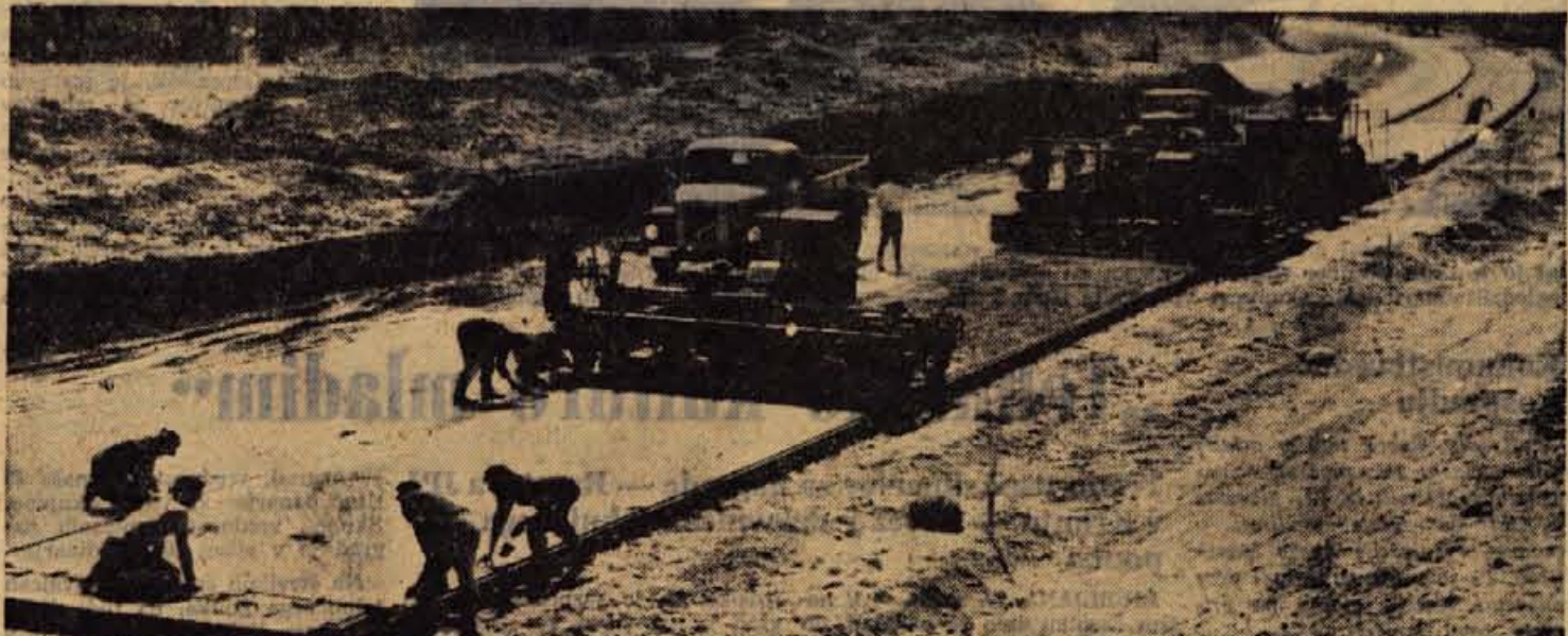
V nadaljevanju del pri izgradnji nove gorenjske magistrale so v Bestrici pričeli betonirati še drugo polovico cestišča. Kot vse kaže, bo ta del ceste še najprej dokončan

Podkoren je najlepši kraj na svetu je pred 140. leti napisal slavni angleški znanstvenik Sir Humphry Davy, pogosti obiskovalec vasice. S svojimi članki v angleških časopisih tedanje dobe, je seznanil angleško javnost z lepoto tega dela Slovenije. Na Čočeljnovi hiši, v kateri je bival, mu je plansko društvo vzdalo spominsko ploščo. Pri tej, četrto tisočletja stari gostilnji, so se nekoč ustavljale volovske in konjske vprege na svoji poti iz Trsta, preko Ljubljane in Korenskega sedla v Beljak in dalje na Dunaj. V koritu ob lipi sredi vasi, so vozniki tedaj napajali vprežno živino, preden so pognali navkreber. Sedaj skozi Podkoren vozijo številni avtomobili. Samo v lanskem letu je tod stekla reka 60 tisoč motornih vozil. Ceste so asfaltirane, zgrajenih in obnovljenih je bilo nekaj hiš, živina se je morala umakniti iz prometnih cest in