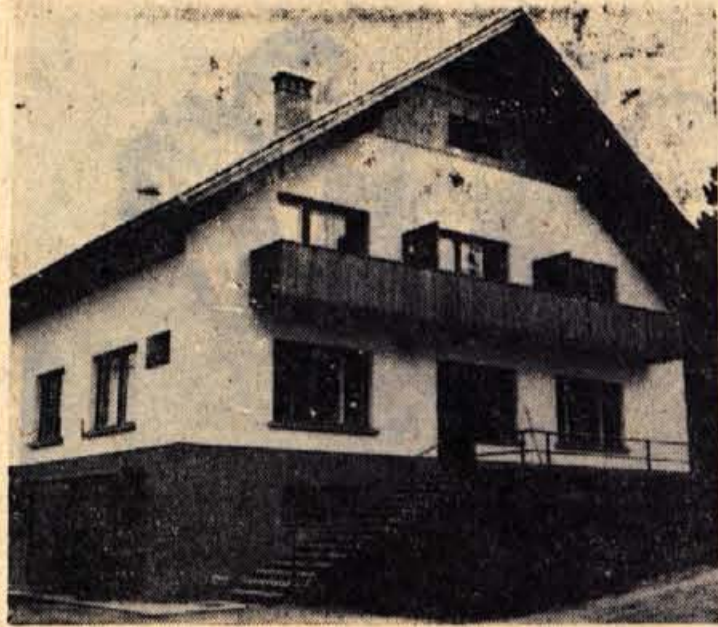
Nov turistični dom na Goropekah nad Ziri, ki so ga lani odprli, je privlačna postojanka in ima možnosti, da postane središče zimskega športa tega kraja