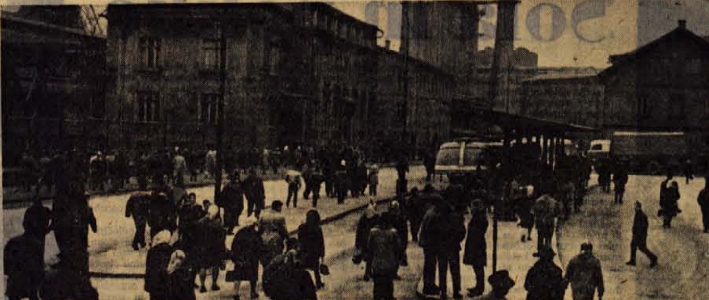
Ob izmenah v Železarni, kjer je zaposlenih velika večina jeseniških delavcev, postanejo ceste zelo živahne. Takrat zazivijo tudi lokalni trgovci