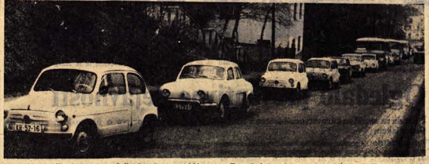
Jelenov klanec v Kranju postaja vse bolj ozko grlo za gorenjski promet. To se že kaže sedaj v pomladanskih dnevih. Kaj pa še bo ob višku turistične sezone!