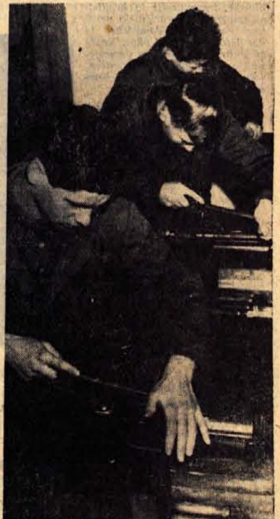
Vajenci kranjske vajenske šole se urijo v praktičnem delu

Naša družba je v zadnjih letih investirala izdatna sredstva v strokovne šole. Na našem področju nimamo več zavoda za strokovno izobraževanje, ki ne bi imel lastnih šolskih delavnic in kvalificiranega kadra za praktično delo. Število profilov (opis opravil, ki naj jih obvlada vsak strokovnjak v ustreznem poklicu) iz dneva v dan raste, republiški organi so izdelali učne načrte za strokovno teoretske in splošno izobraževalne predmete, učno-vzgojno osebe na poklicnih šolah pripravljajo podrobne učne načrte, tako da bomo s prihodnjim šolskim letom družbena prizadevanja za reformo bivših vajenskih šol realizirali in uvedli na tem področju tak izobraževalni sistem, ki ga narekujejo sodobni tehnološki procesi in delitve dela. Dosedanji vajenski način izobraževanja bo stvar preteklosti, mi pa bomo organizirali poklicne šole, kjer se bodo učenci učili le to, kar bodo v svojem poklicu potrebovali. S tem pa bo odpravljeno največje zlo dosedanjega vajenskega sistema, ko je moral vajenec opravljati tudi razna priložnostna dela in morda tudi opravila, ki niso povezana z njegovim poklicem. Vajenci so prejemali spričevalo o opravljenem izpitu za pomočnika ali kvalificiranega delavca, njihovo praktično znanje pa je zajemalo le nekaj operacij. V poklicnih šolah se bodo učenci v šolah naučili osnovnih delovnih procesov, delovišče pa bo to znanje po predpisanim načrtu razširjalo in poglobljalo. Kontrolno pa bo iz-