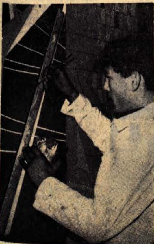
Za plekarsko in soboslikarsko stroko, kot tudi za nekatere druge, primanjkuje vajencev. Na slikki plekarski vajenec, ki se je z veseljem oprjel tega poklica

KRANJ — Pri vseh dosedanjih prometno-vzgojnih akcijah, od občinskih do zveznih, je bilo v praksi, da se je posvečalo pozornost le osnovno-šolski mladini, dočim so bili dijaki gimnazije in srednjih šol pozabljeni. V kranjski občini so na tem področju veliko naredili, vendar še ne moremo biti zadovoljni z znanjem prometne vzgoje na že omenjenih šolah. Občinska komisija za vzgojo in varnost v cestnem prometu pri občinski skupščini Kranj je v minulem tednu izvršila poskusno testiranje na nekaterih srednjih šolah in v gimnaziji. Rezultat je bil sicer zadovoljiv, saj je od skupnega števila 377 testiranih dijakov pravilno odgovorilo 69,85 procentov, vendar bi bil uspeh lahko večji, če bi se na teh šolah vsaj občasno poučevala prometna vzgoja. — R.