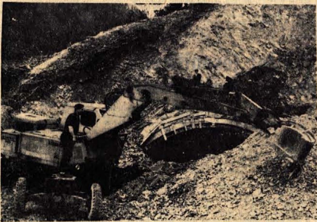
V najdaljšem izmed predorov nad Tržičem sedaj odstranjujejo odvečno zemljo. Potem pa bodo pričeli betonirati temelje

● Radovljica — Občinska skupščina je na petkovi seji potrdila soglasje k sklepoma komunalne skupnosti socialnega zavarovanja o določitvi osnovnega prispevka in o višini dodatnega prispevka za zdravstveno zavarovanje. Na območju radovljiške občine je 16 tisoč zavarovancev, od tega je 9 tisoč aktivnih, 2.127 pa jih uživa starostno pokojnino. V občini je tudi 3283 kmetijskih zavarovancev.