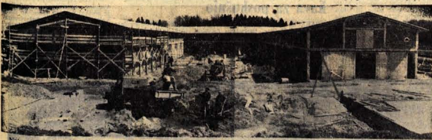
Notranja dela pri izgradnji hlevov na Sorskem polju pri Zabnici so že zaključena. Sedaj jih urejujejo le še zunaj, tako da jih bodo svojemu namenu izročili že 1. maja. Ob tej priložnosti bo tam slovesna otvoritev

nosti. Tako bodo tudi cestno med predori verjetno asfaltirali prej kot pa bodo le-ti gotovi, in bo torej celotna trasa lahko končana do zadnjega roka izgradnje — 30. junija, ker bo naslednji dan že slavnostna otvoritev. Ljubeljsko cesto so si v zadnjem času ogledale različne komisije, ki jih zanima predvsem, kakšne so možnosti, da bodo dela končana do roka. Prihodnji teden bo na gradbišče poslala odpravo tudi tržiška občinska skupščina, ki jo zanima predvsem, kako bodo izvajalci rešili vprašanje lokalne ljubeljske ceste in odcepov v stanovanjska naselja. — Z.