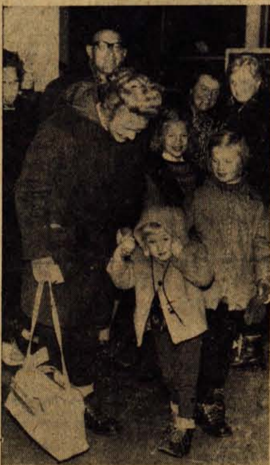
Mlada Nizozemka se nikakor ni pustila fotografirati. Slednjilc so jo ujeli z mamko.