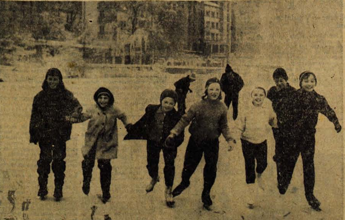
ZIMSKO VESELJE NA BLEJSKEM JEZERU