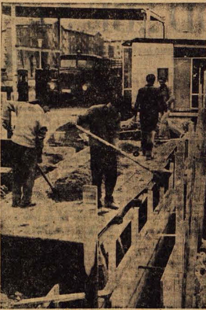
Pri bencinski črpalki na Zlatem polju so pričeli z gradnjo pralnice osebnih avtomobilov. Ta objekt bo prvi te vrste na Gorenjskem; imajo pa jih že v Postojni in Portorožu. Pralnica, v kateri bodo lahko hkrati čistili dva avtomobila, bo zgrajena že konec maja.

JESENICE — Mlad človek danes pri izbiri poklica ni prepuščen samemu sebi kot je bil nekoč. Poleg staršev in vzgojiteljev odigrava večjo vlogo poklicne posvetovalnice. Razumljivo je, da so prvi starši, ki žele, da bi bil njihov otrok v življenju srečen. Vpliv staršev je na otroke tudi najodločilnejši. Primeri pa se, da si otroci izberejo poklic, ki ni vseh staršem. V tem primeru morajo starši spoštovati otrokove sposobnosti, nagnenje in veselje. Praviloma naj si otrok izbere poklic sam. Starši šola in poklicna posvetovalnica pa naj igrajo le vlogo svetovalca. Vedno več primerov je, da se otroci pri izbiri poklica posvetujejo s šolskimi, starši, učitelji in tudi na poklicni posvetovalnici. Leta 1962 je iskalo nasvet v jeseniški poklicni posvetovalnici le 176 otrok, lani jih je iskalo 299, kar dokazuje, da ima posvetovalnica vedno večji pomen. S široko akcijo kakršno izvajajo letos, se bo poklicno usmerjanje mladine lahko razvilo v družbeno aktivnost širšega pomena.