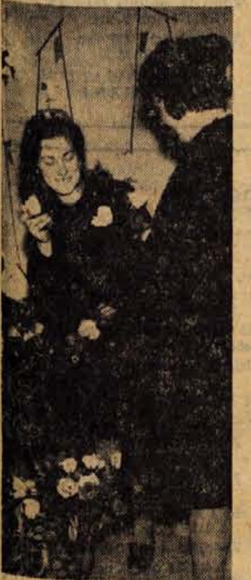
Med drugimi lokali so v Skofji Loki odprli tudi novo cvetličarno, ki so jo že dolgo pogrešali.

Pogovarjali smo se tudi, kako je s štipendiranjem kadrov v gostinstvu. Podjetja v tem delu nimajo štipendistov, ker imajo za ta namen premalo sredstev.