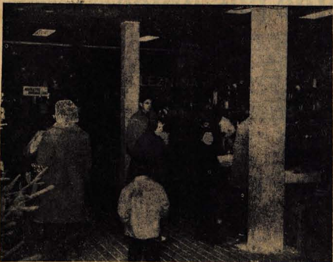
Letošnji novoletni sejem v Radovljici je bil v spodnjih prostorih nove trgovsko poslovne zgradbe za avtobusno postajo. Objekt sicer še ni popolnoma urejen, vendar je za potrebe sejma, ki je bil prejšnja leta kar na prostem, zadoščal. Vsi, ki so sode lovili na sejmu, so z doseženim prometom kar zadovoljni.