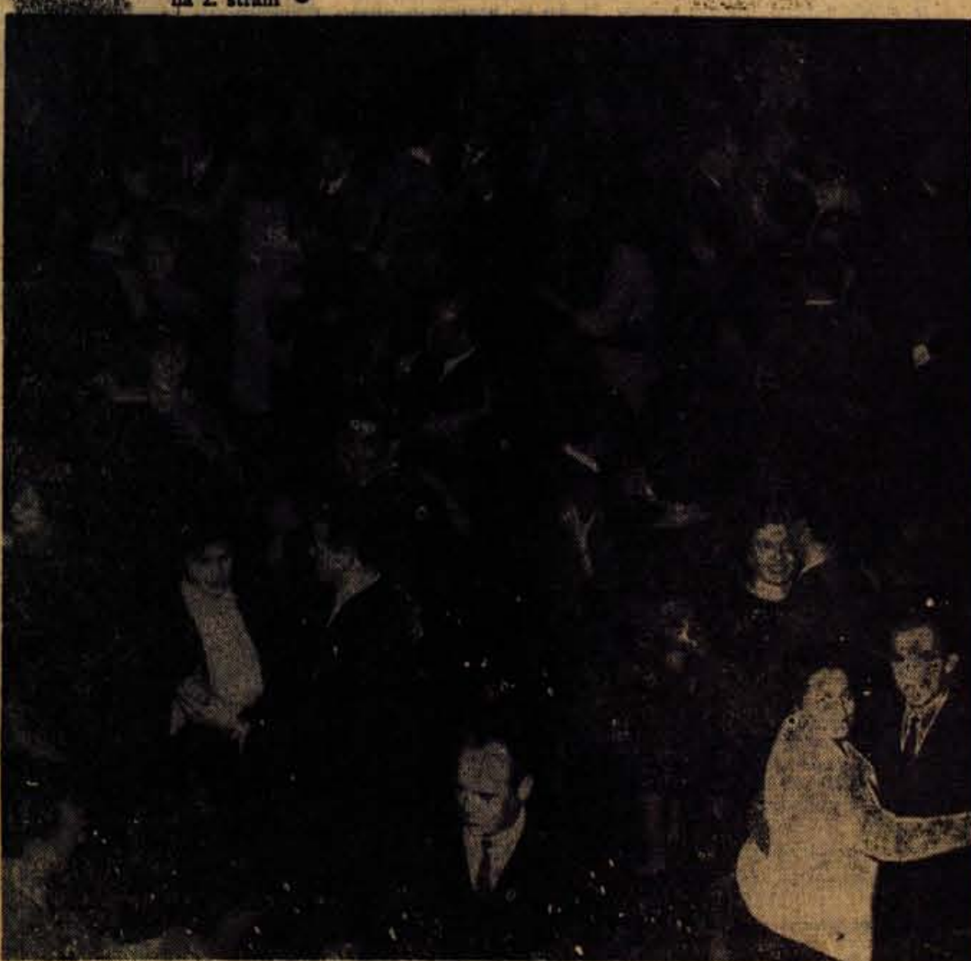
Prizor, ki je bil na Silvestrovo tako na Gorenjskem kot tudi drugod najbolj pogost. Posneli smo ga v domu Partizana v Strliču

di pri nas, skupina danskih mladink, tu sta bila tudi avstrijski in nemški konzul in mnogi drugi gosti.